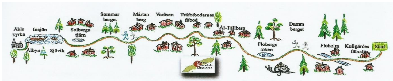
Karta över Kyrkstigen av Per Gustafsson från Trons Lasse Mattssons rapport om upprustningen.

Projektet har finansierats med statliga medel från Länsstyrelsen i projektet Lokala Naturvårdssatsningen LONA.