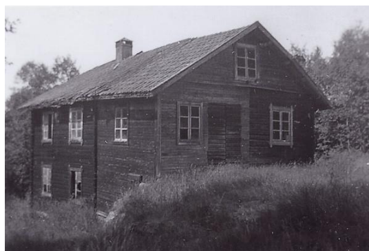
Helgbo kvarn när den var i drift