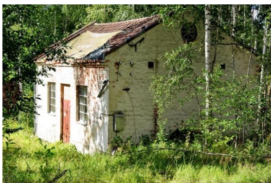
Helgbo kraftstation idag.