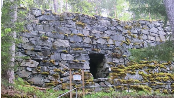
Från Gruvvandringen: "Kônsta" i Solberga