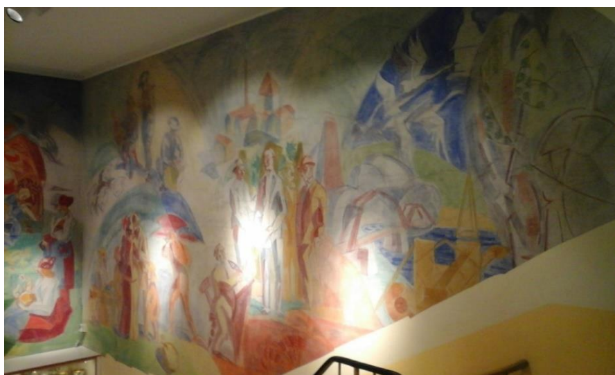
Insjöns skola: Del av målningen

Förhoppningsvis ska det gå att få till en visning av verket så att den intresserade ska kunna ta del av det på plats, sitta en stund i trappan och låta ögonen följa det historiska skeendet. Till detta ber vi att få återkomma med information längre fram.