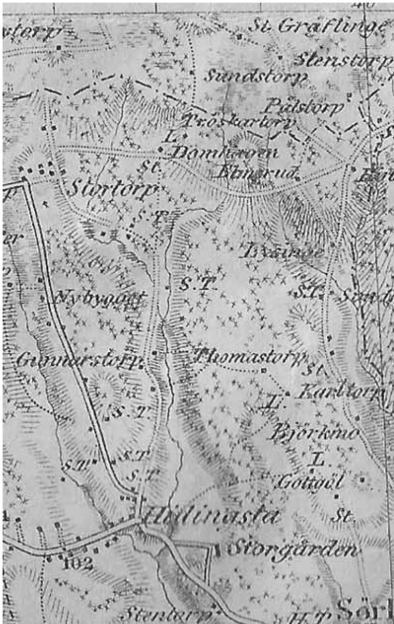
Generalstabskartan, uppmätt på 1830-talet och reviderad på 1840-talet. Byarna är ännu inte skiftade och längs den nybyggda vägen har fastigheten Nybygget uppstått. I övrigt finns Hidingastas knekttorp längs den nya vägen.