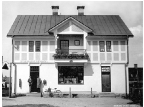
Affären Hållsta öppnade 1909 nära kyrkan och var länge den enda i själva Almby.

Världskriget började 1914 och var inte så märkbart i vårt land. Karlarna blev inkallade till extra militärtjänst, husbyggnationen avstannade och priserna gick upp som en följd av kriget. Skofabrikerna exporterade skor i stor mängd och vissa bönder många hästar till Centralmakterna och så småningom också livsmedel från grossisterna. Det blev brist på varor i affärerna och som en följd