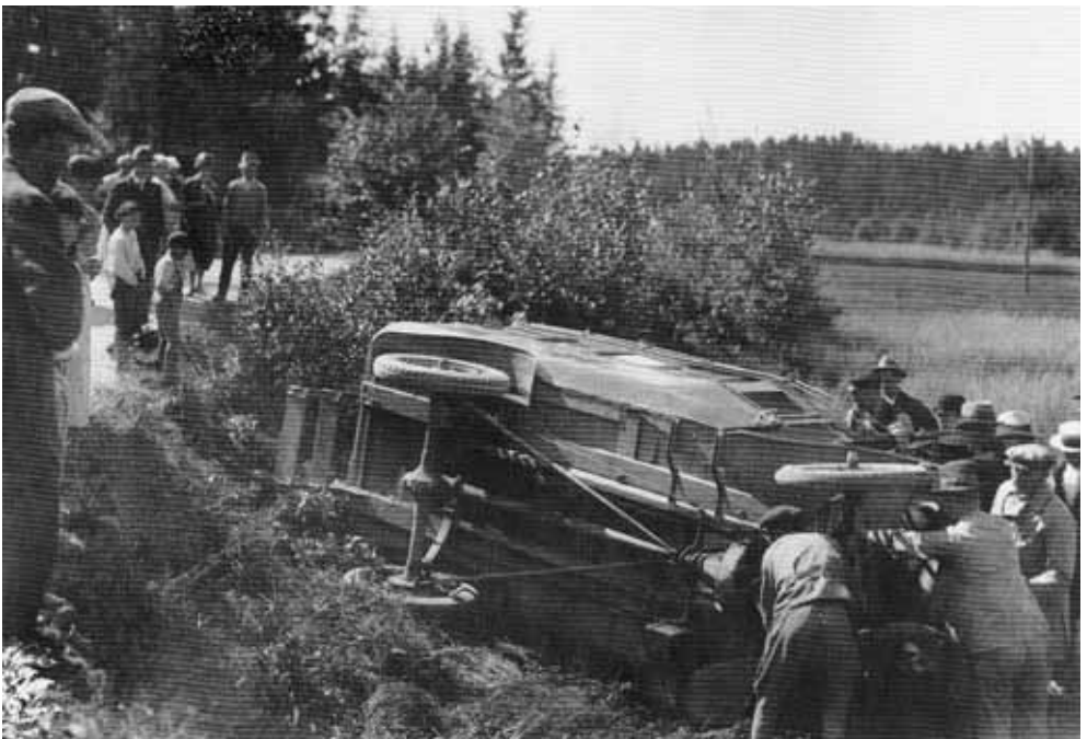
Bussolycka 1923 i Murarkröken i Brickeberg.

Barnen till de unga familjer som flyttade in i Almby under de första åren på 1900-talet hade i början av 1920-talet blivit tonåringar och unga vuxna. Efter OS i Stockholm 1912 hade intresset för idrott vuxit också i arbetarkretsar (idrott tidigare