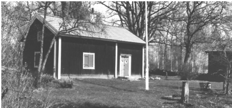
1960-talet.