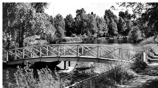
Dammen i Långbro park, troligen 1931.