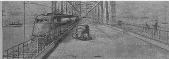
Hur bron mellan Sverige och Danmark skulle komma att taga sig ut enligt förslaget.

Särskilt på bilisthåll är intresset för den föreslagna bron över Öresund mycket stort, och man framhåller, att den skulle inte endast medföra en kolossal ökning i turisttrafiken, utan även leda till en stark