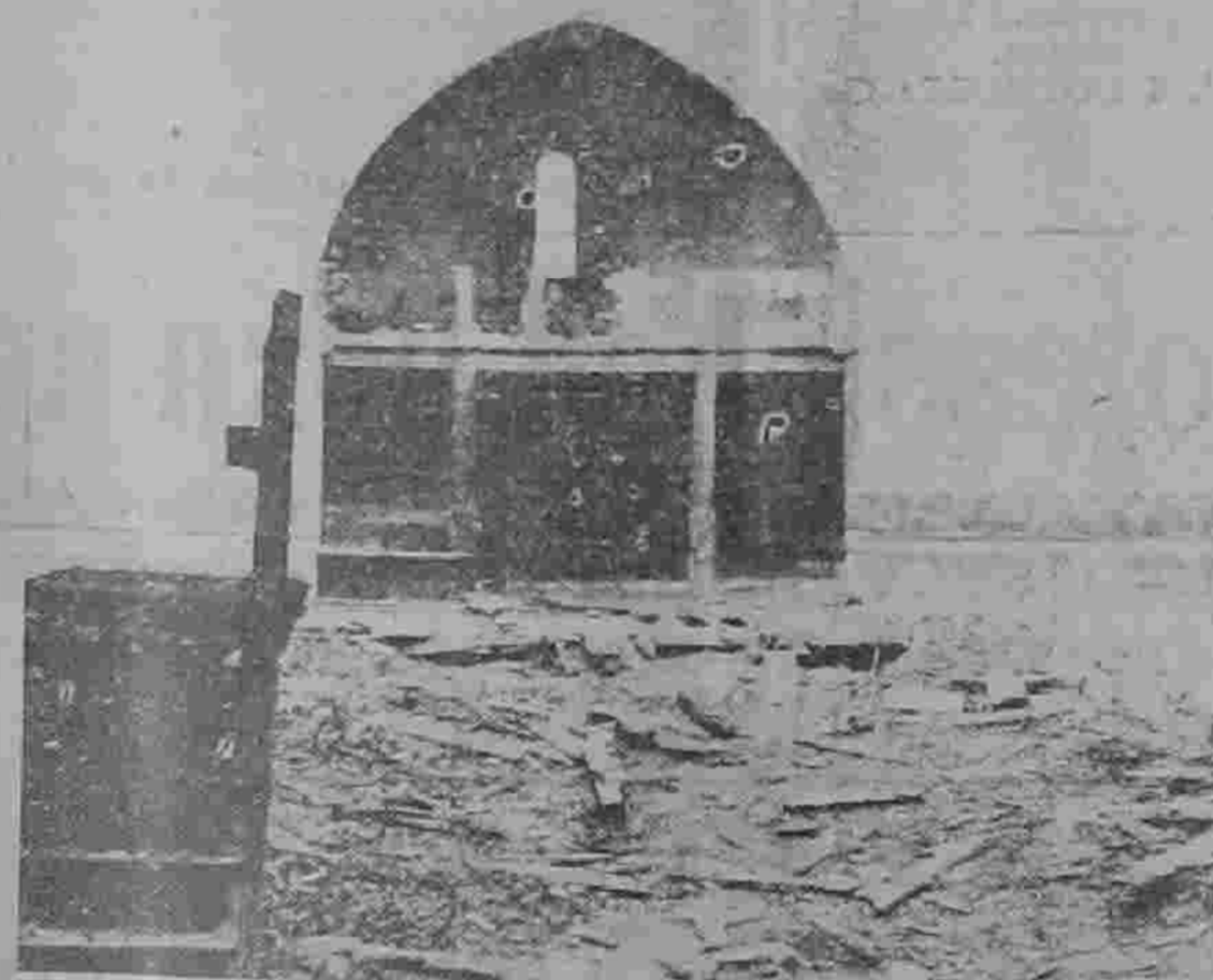
Hur grundligt härjad av elden Ala kyrka blev framgår tydligt av ovanstående bilder, tagna omedelbart efter branden. Överst t. v. exteriör av kyrkan. Som man ser stå endast murarna kvar. T. h. en annan bild av förödelsens utvägelse. Under t. v. interiör mot altaret med den anbrända predikastolen till höger. Bilden t. h. mot orgelläktaren visar hur hela inredningen förstörts. Orgeln lyckades man dock rädda.