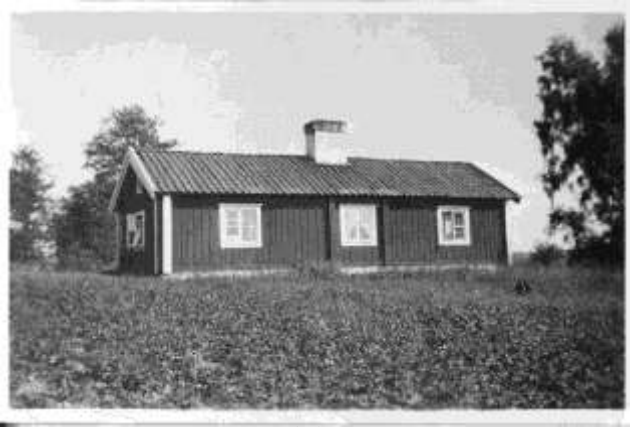
Torpet Floda c:a 1940

Det är väl inga överord om man år 2005 vågar påstå att livet på och omkring Ekeby markant förändrats under de 183 år som förflutit.