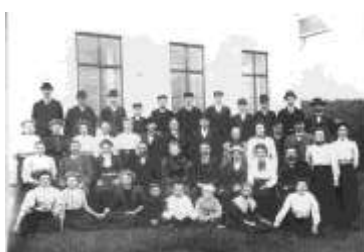
Godtemplare utanför småskolan på 1920-talet

Godtemplarlogen Peringskiöld startades i I Över-Enhörna av Gustav Kjällström den 1/3 1908 och sammanslogs med logen God Vilja i Ytter-Enhörna den 7/7 1942. I Över-Enhörna fanns också en ungdoms loge som hette 1911 Morgonstjärna. På 1920-talet var inträdesavgiften en krona i logen 3879 Peringskiöld. Redan 1830 började man bilda nykterhetsföreningar i Sverige.