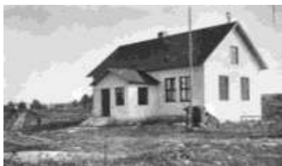
Missionshuset i Överenhörna omkring 1900.

Överenhörna Missionsförsamling. Det bildades en "Missionskrets" år 1896 som då direkt anslöt sig till församlingen i Södertälje. Så gjordes en insamling som gav möjlighet bygga missionshuset Betania vilket invigdes 1912. Bygget var först planerat intill Majhem i Nöttesta men byggdes på den tomt vid Söderby som Theodor Rosenberg upplät. Aktiviteterna avtog med åren. På 1950-talet hölls fortfarande söndagsskola.