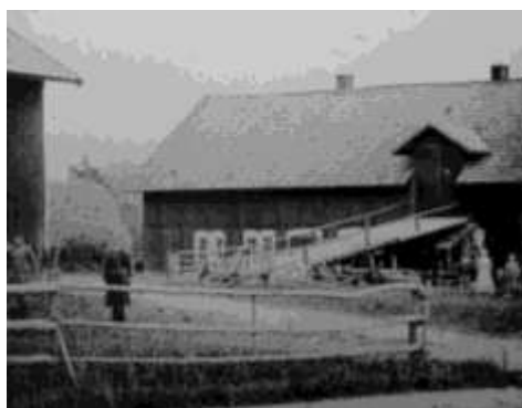
Årby loge före 1950

Just i slutet av 1990-talet startade Enhörna Teaterförening sin Gammaldags Julmarknad som är en flitigt besökt och uppskattad tradition. Julmarknaden som hålls i Årby loge i december bjuder på sång av Enhörnakören och försäljning av alster från bygden. Här bjuds julgranar, Hembygdsföreningens bokbord, korv- grillning av "Hornkorv", kaffeservering mm. Enhörna-tomten brukar gå runt och bjuda julgodis.