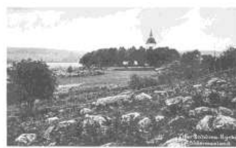
Gillberga backe omkring 1900

Enhörna Trädvårdsförenings Julglimmer är en nyare föreningstradition. Koncentreras numera kring Kårsbärlunden i Gillberga backe.