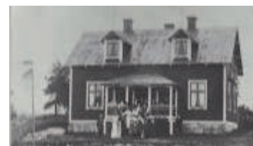
Överblick. Godtemplare i Ytterenhörna 1912

Logen 1934 God Vilja bildades den 21 januari 1894 vid Sundsvik i Turinge. Hade från starten 19 medlemmar varav 11 st tillhörde Logen 1608 Eric Dahlbergs Minne. År 1907 flyttades logen God Vilja till Ytter-Enhörna. Efter år av lokalbekymmer och träget arbete kunde man den 15 januari 1911 inviga sin egen lokal Överblick. Inom logen God Vilja