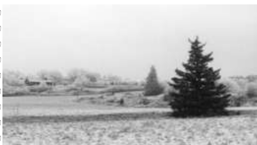
Hembygdsgranen vid Lill-Ahl

Enhörna Hembygdsförening står bakom jultraditionen med belysning av den ståtliga granen vid Lill-Ahls väg-kors.