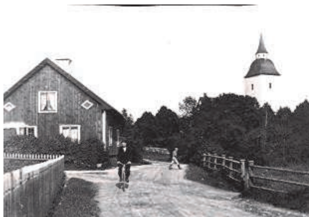
Tuna Skola i början på 1900-talet

Motioner till årsmötet ska vara styrelsen tillhanda senast 2005-04-16