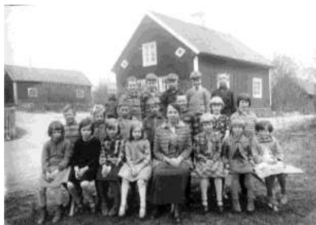
Klassfoto utanför Tuna Skola. Året är 1929