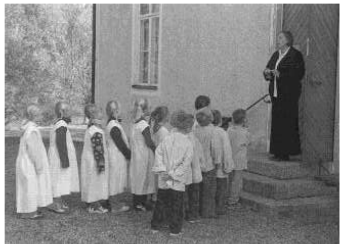
F-Klass A väntar på att få gå in i skolan