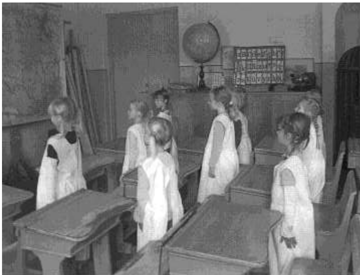
F-Klass B har lektion

annan ville också prova på att stå i skamvrån. Det var en allmän mening att skolböckerna från förr var mycket tråkigare än vad de är idag. Vad svårt det måste ha varit att skriva skrivstil med bläck och med en så konstig penna!