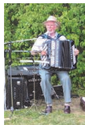
Cay spelar och underhåller