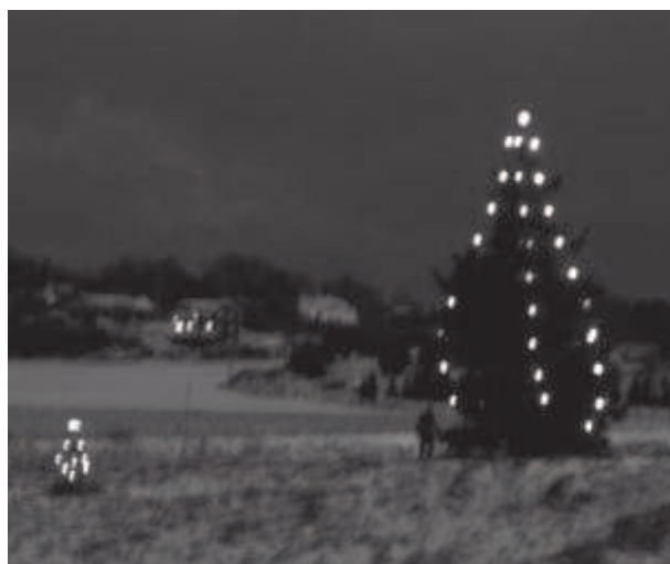
Hembygdsgranarna vid Lill-Ahls korset, 2008

Trädvårdsföreningen som anordnar glimret har verkligen skapat en unik jultradition i Enhörna. Låt oss alla visa vår uppskattning av trädvårdarnas arbete genom att samtidigt som körsbärlunden lysas upp, tända ett par marschaller i den egna trädgården. Det kan bli ett glimmer av sällan skådat slag!