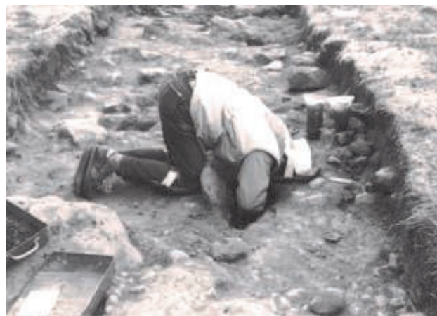
Exempel på en ung ambitiös "arkeolog" vid utgrävningarna av kungsgården Husaby-Enhörna

Hör av dig till mig på tel 552 460 54 eller Inga.Ekvall@sodertalje.se