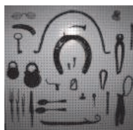
Tavlan i Nöttesta