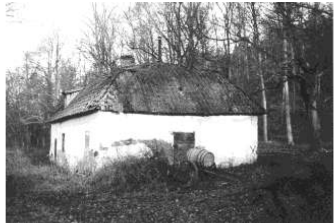
Ekensbergs slottsbränneri från 1798, foto 1940-tal

des Brännerigatan ända långt in på 1900-talet fastän den tiden var länge sedan förbi.