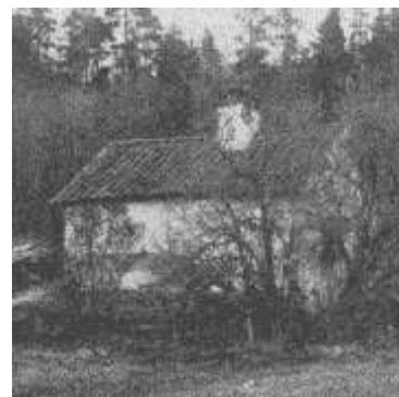
Grönalund, början av 1900-talet (Bianchini)