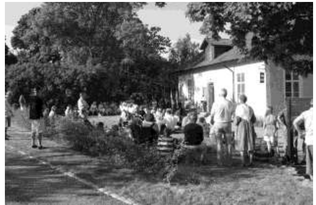
Från förra årets nationaldagsfirande

Mer information kommer i nästa nummer av Hembygdsbladet