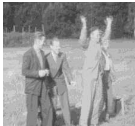
Entusiastiska hemmasupportrar jublar efter mål av EIF

I januari 1957 brann friluftsgården ner. Arbetet med att återuppbygga anläggningen startade genast och redan året efter kunde den nya friluftsgården invigas. Arbetet filmades av kyrkoherden Claes I:son Lundin. Filmen (c:a 20 minuter) om återuppbyggnaden av friluftsgården och en spännande fotbollsmatch visas och kommenteras av Kicki Alfredsson.