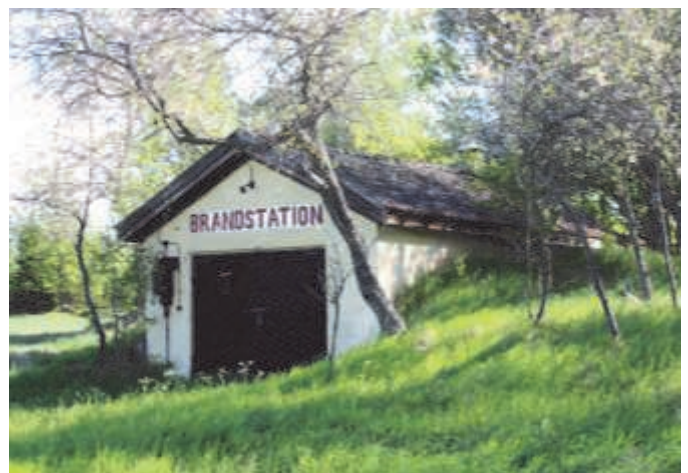
Brandstationen vid Klosterhagen

Om vi går ytterligare framåt i tiden. Den ordinarie kom.stämman i Över-Enhörna klubbade, 10 april 1938, förslaget att bilda gemensam skogsbrandrote med Ytter-Enhörna under förutsättning att nämnda kommun godkänner förslaget, samt antogs förslag till avtal.