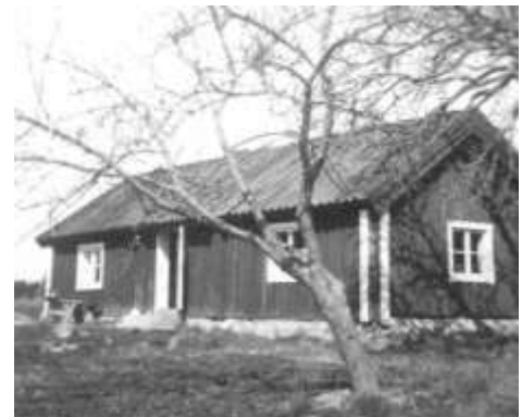
Torpet Häll ligger på vägen mot Lövsta

Torpet Häll blev sommarbostaden från 1948 och i Enhörna blev han mycket omtyckt och hjälpte bl.a. EIF genom sina figurer i deras julkalendrar. I umgängeskretsen kring Leendet ingick förutom många enhörnabor också konstnärskollegor som träffades i Falkgården på somrarna.