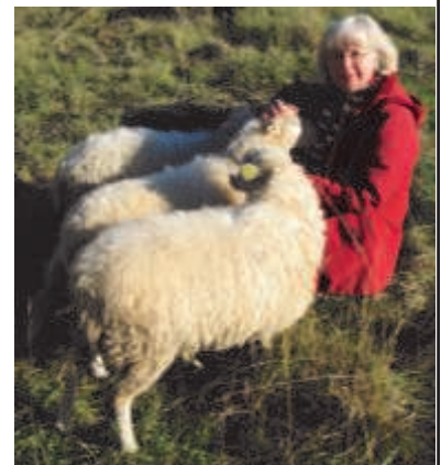
Även vuxna får klappa de keliga Husaby-fären