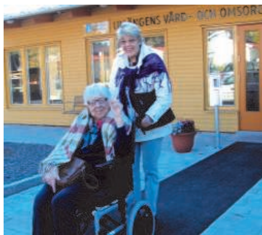
På väg till Gripsholms Vårdshus