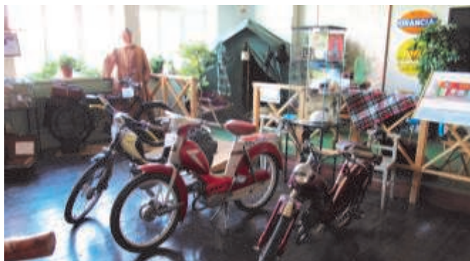
Mopeder, motorcykel och campingplatsen.