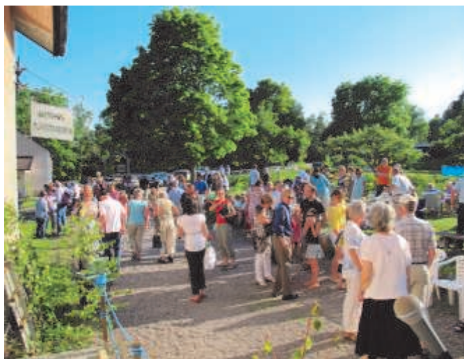
En underbar försommarkväll vid museet