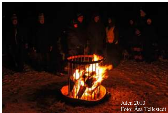
Julen 2010

En rejäl eld att värma sig vid kommer också att finnas.