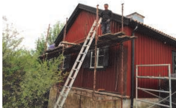
En hembygdsvän målar fasaden på Bygdegården