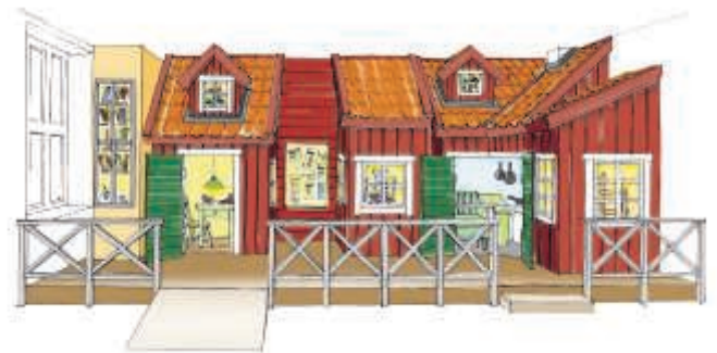
Arbetskissen som ligger till grund för vårt arbete med kvinnomiljön. Skissen finns att se i Storskolan