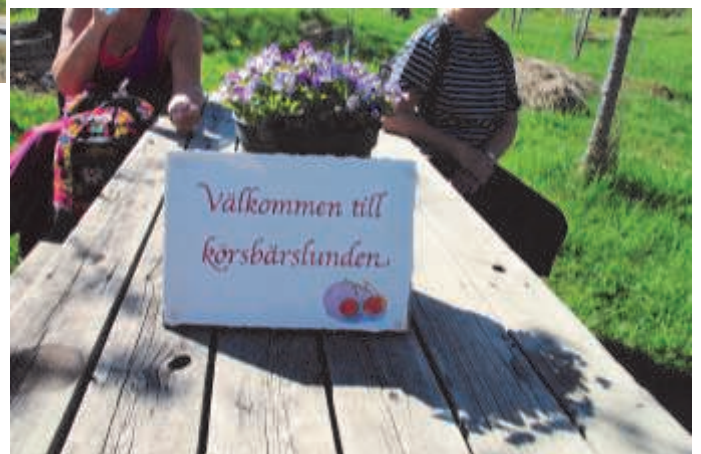
Trädvårdsföreningen hälsade oss välkommen till Gillberga kulle.