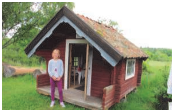
Lekstugan lockar många barn

Det som vi i styrelsen framför allt gläds åt är alla nya grupper av besökare som hittat ut till vårt museum. Att många enhörnabor besöker oss det vet vi, men att så många från Södertälje, Nykvarn, Mariefred, Strängnäs, Stockholm m fl platser också hittat ut till oss är