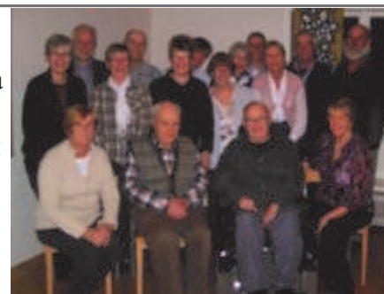
Förra årets samtalscirkel