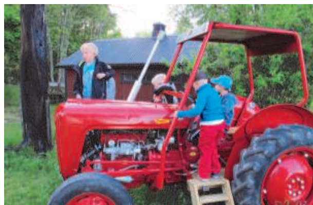
Traktorn har blivit en attraktion

Den blandning av utställningar vi har med såväl Enhörnahistoria som lite mer allmän nostalgi i form av Moppesemester på 50-talet verkar tilltala många.