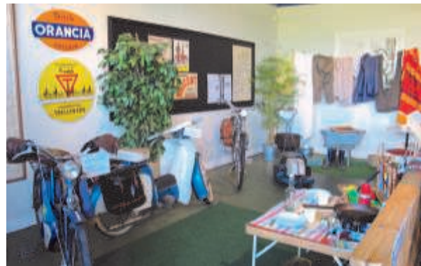
Moppesemester på 50-talet

till oss. Extra glädjande är också att allt fler handikappade har upptäckt att man kan komma och se utställningarna.