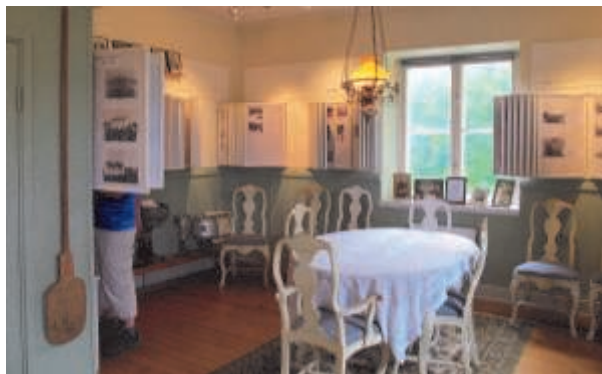
Fotosalen med c:a 1.000 dokumenterade fotografier

I samband med nationaldagsfirandet öppnades museet för säsongen. Så många besökare som i år har vi aldrig haft. Vissa söndagar har det kommit uppåt 100 personer och parkering har varit ”knökfull”.