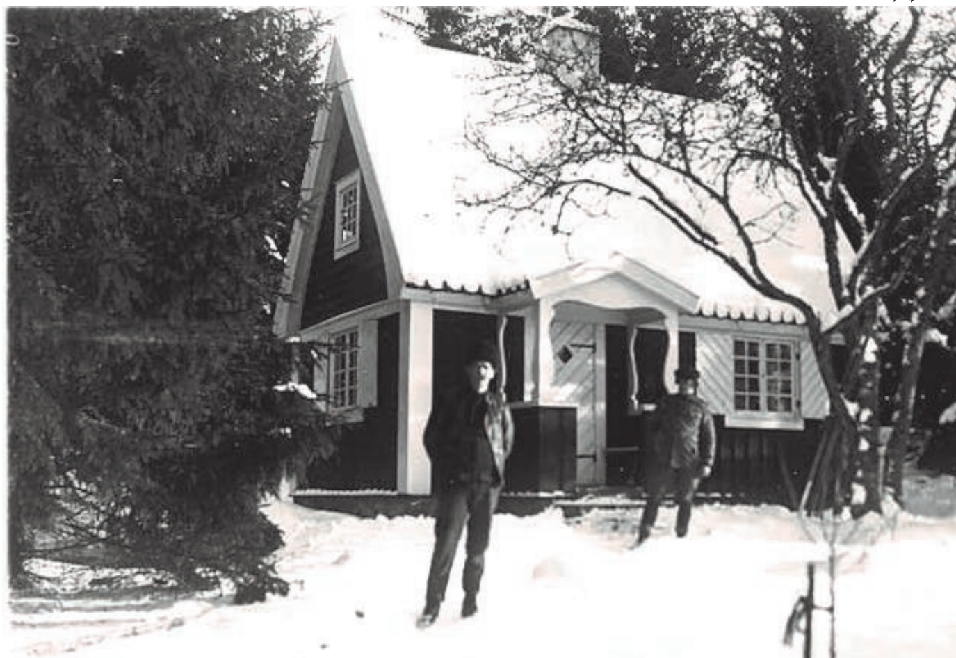
Vintern 1929. Västerudd på Slandön. Fanjunkare Bengt Mellin byggde Västerudd 1925. Stället kallades "Fanjunkarns udde" av Enhörnaborna. Fanjunkaren med äldste sonen Bengt.