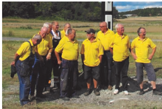
Y-frontare, i arbetsuniform, framför Facklan