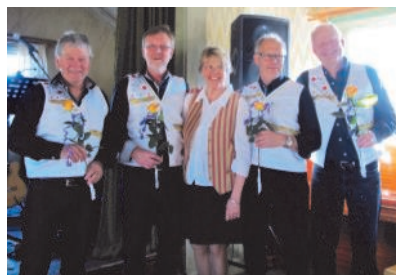
Orkestern med en trogen beundrarinna