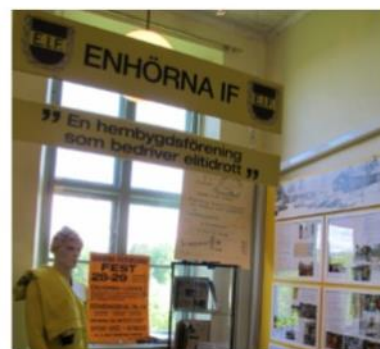
EIF är viktig en del av Enhörnas historia. Se hur föreningen utvecklats från starten 1928.