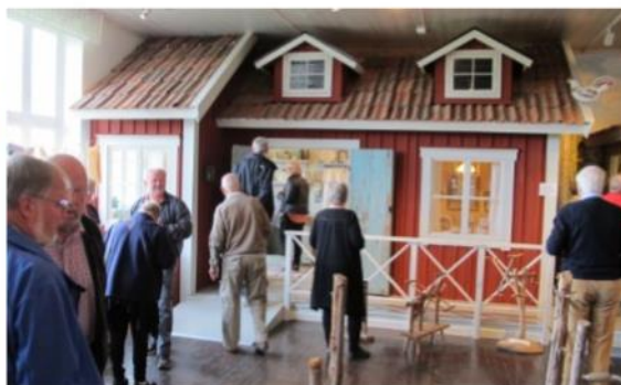
Lantköket med matplats, pigsoffa och vedspis, salen till höger. Vävrum och Magdas syateljé i boden intill.