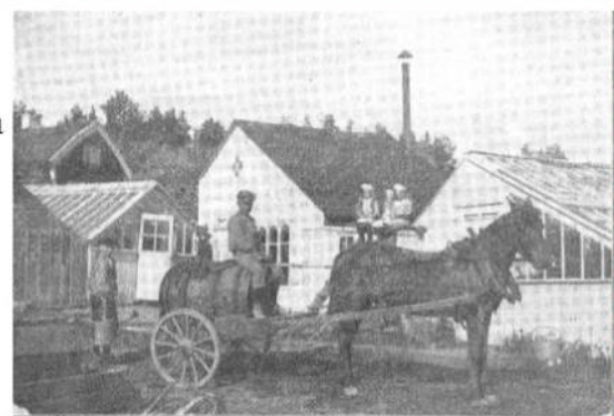
Norrlöts trädgård, Stenby, Ytter-Enhörna. 1910-tal.