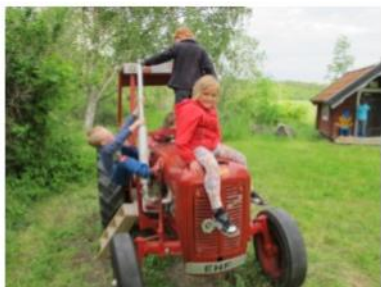
En äkta traktor att leka med. I bakgrunden syns lekstugan från mitten av 1900-talet.

Söndagar 13-16, juni-september, öppet för alla, ingen avgift Hembygds museet ligger vid Överenhörna kyrka. Buss 787 stannar vid kyrkan.