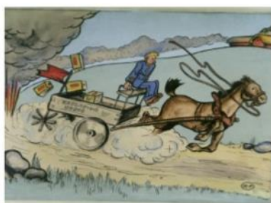
Drygt 60 teckningar av Rudolf Petersson (91:an)