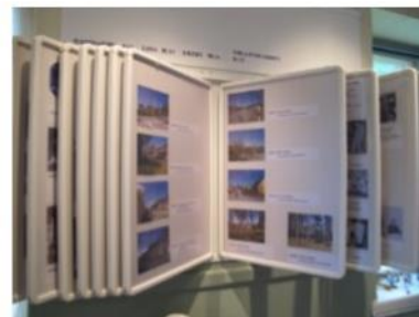
Över 1200 foton med texter ingår i vår fotoutställning.

Besök Enhörnas eget hembygdsmuseum. Upplev det gamla Enhörna. Låt barnen leka i en miljö från förr. Lär känna miljöer och personligheter från gångna tider. Koppla av med en kopp kaffe/saft och hembakt bröd.