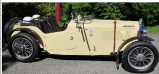
På 30-talet lanserade den engelska bilfabriken MG tävlingsbilarna Athos, Porthos och Aramis. "Musketörerna" blev mycket framgångsrika på racertävlingar i Europa. Aramis från 1934, ingår i visningen.