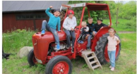
Alla lyssnade inte till talet och sången utan roade sig själva