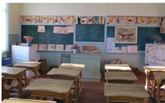
Skolsalen från början av 1900-talet. Lockar barn att leka skola, att läsa Lyckoslanten och KP.