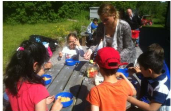
Lunch i solen på skolgården