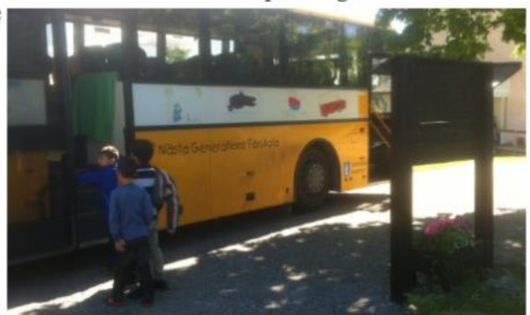
Dags för hemfärd