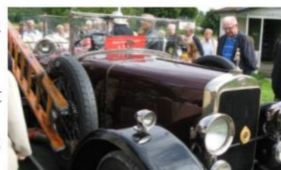
Sunbeam från 1926, av samma typ som EFBK (Enhörna Frivilliga Brandkår) använde att dra brandsprutan med.

Omkring 15 bilar plus ett antal mopeder och motorcyklar räknar vi med ska komma