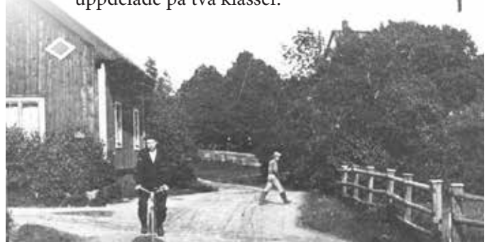
Tuna Skola, det som idag är Församlingshemmet.

Mälby skola som var övervåningen i Askå handel användes åren 1911-1917. Askå skola byggdes 1916 och var både små- och storskola under olika perioder. Här undervisades i slöjd. I skolan fanns också lärarbostäder. Skolan var så modern att den hade en vattenbehållare för dricksvatten på en yttervägg. Vallaskolan byggdes på 1880-talet och var s.k. storskola. Redan år 1871 omnämns ett skolhus vid Tuna som låg mitt emot det nuvarande församlingshemmet. En gammal enhörnabo gick i Tuna skola år 1916 och berättar att skolan redan då var gammal och att skolsalen upptog större delen av huset. Där gick då 25 elever uppdelade på två klasser.