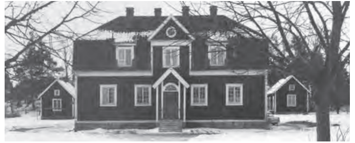
Askå skola byggd år 1916.

Under 1900-talets första hälft fanns sju skolor i Ytterenhörna och Överenhörna. Broberga skola eller Nora skola låg på vägen mot Löfsta men den brann ner på 1960-talet. Här undervisades årskurs 1 och 2.