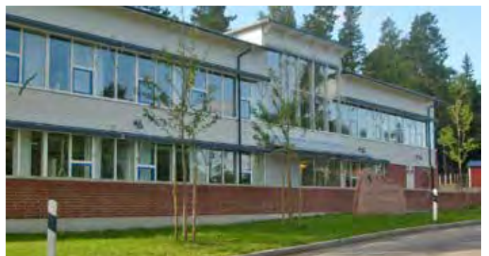
Stora byggnaden i den nuvarande Vallaskolan vid Sandviksvägen.

Tuna skola revs och användes till uppbyggnad av församlingshemmet. Årslönen 1933 var 3000 kronor för en folkskollärare och 1900 för en folkskollärlarinna och för småskollärlarinnan 1350 kronor. Idag är Askå och Valla skolor privatägda. Skolorna i Överenhörna är museum. Alla elever i Enhörna undervisas i ”nya” Vallaskolan sen 1966.