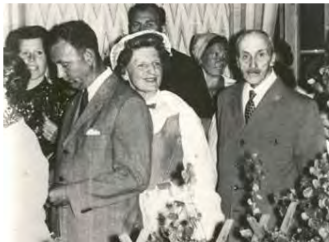
Grevinnan i mitten.