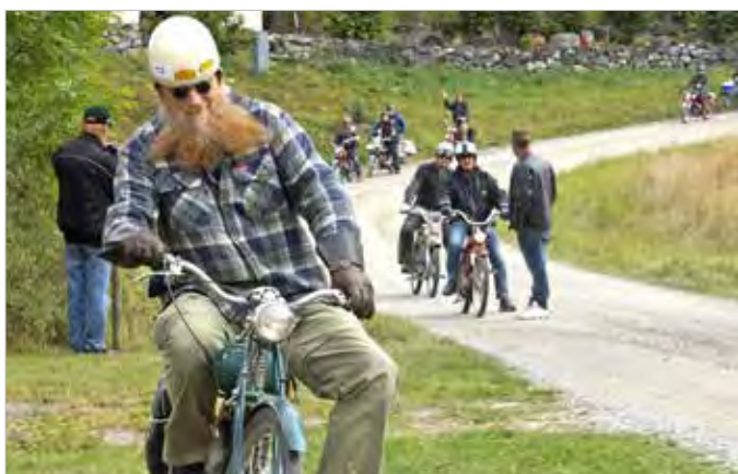
Mopedrally ett mycket omtyckt evenemang, 17 september