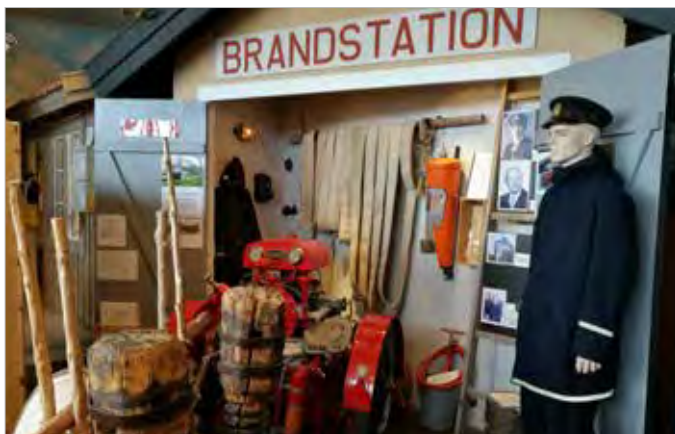
Museet med sina många unika delutställningar