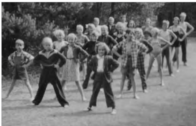
Gammaldags skoldag 11 juni. På bilden simundervisning