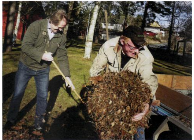
Full fart på vårstädningen.

I år rödfärgades några av husen med hjälp av såväl anlitad som frivillig arbetskraft