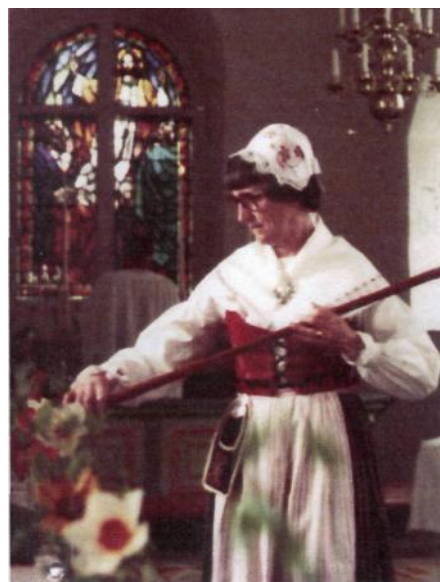
Två av mina stora intressen. Vävning t. v. och kyrkvärdskapet t.h.