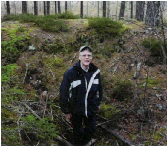
Unik fångstgrop i Socknamon