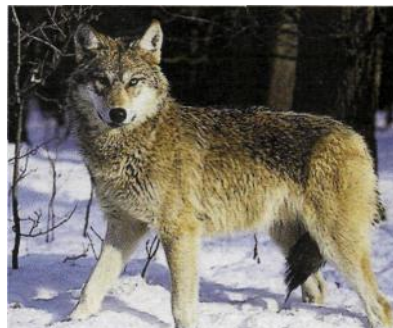
Vargen - hur farlig är den?

nen medverka till] "att genom höga premier (=belöningar) uppmuntra till vargens dödande och slutligen fullkomliga utrotande." Bidrag till premiepengarna skulle beräknas "efter antalet afvelsdjur hvar och en äger". Tydliga tecken således på att vargen var djupt impopulär, kanske främst på grund av hotet mot tamdjuren, som man var så beroende av för livsuppehållet.