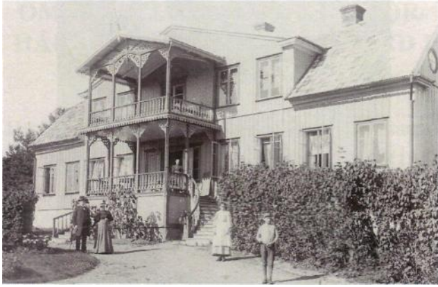
Öringe manbyggnad från 1899 med Malmborgare framför huset.