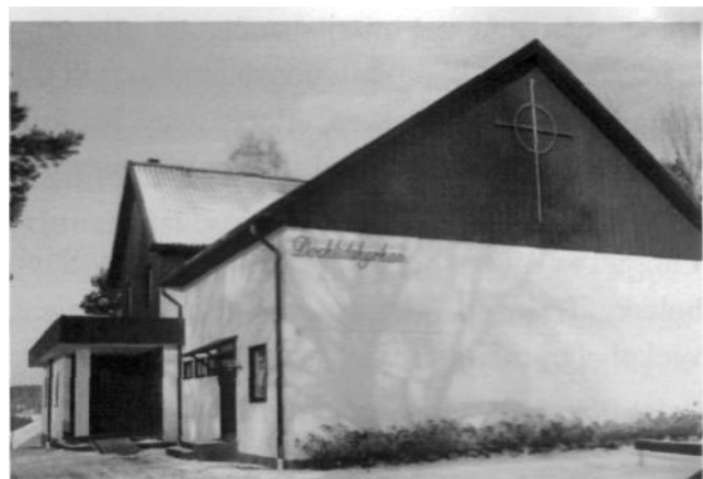
Docklidskyrkan, f.d. Ebeneser i Frinnaryd.

För närvarande samlas Solglimten , en barngrupp i åldern 4-7 år och UV för åldern 7-12 år varje tisdagskväll i samarbete med alliansförsamlingen, var annan gång i Docklidskyrkan, var annan i Allianskyrkan. De äldre ungdomarna. Upptäckarna , har sina samlingar var annan fredagskväll.