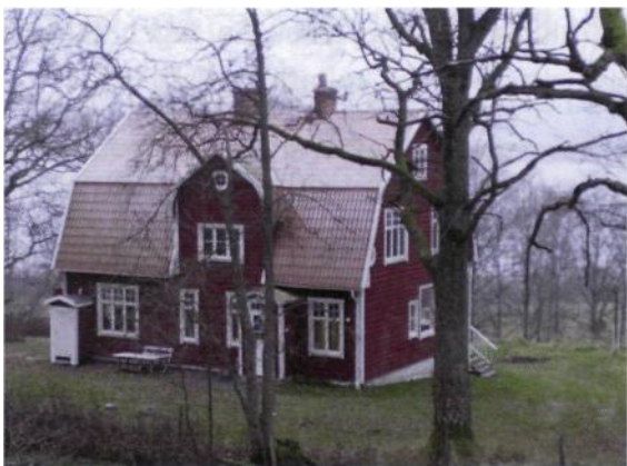
Villan har idag, 2011, fått en dansk ägare och håller på att renoveras.