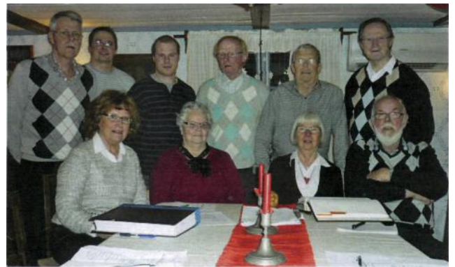
Styrelsen år 2011.