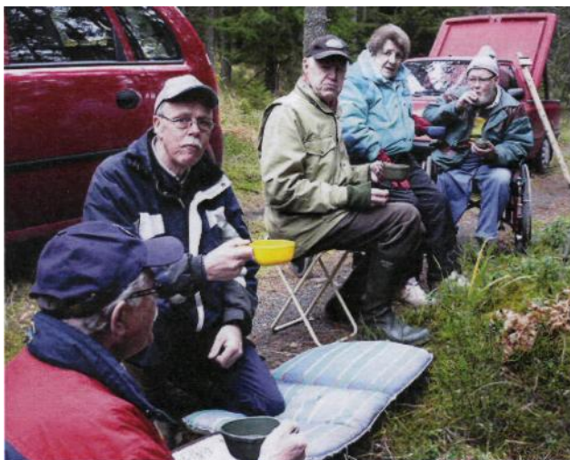
Kaffestund i nära anslutning till den gamla kolbotten.

1. Äldre jaktredskap för jakt av älg, varg och ren samt i mindre utsträckning även för räv och björn. Består av grävda fallgropar med eller utan sparkkista av sten eller trä. 3-4 meter i diameter och c:a 2,5 meter djupa. Groparna doldes av icke bärande tak av grenar och mossor. Förbjöds i lag år 1864.