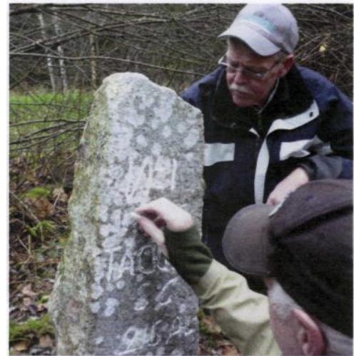
Texten på Täckarpstenen förbättras med krita.

1. Äldre jaktredskap för jakt av älg, varg och ren samt i mindre utsträckning även för räv och björn. Består av grävda fallgropar med eller utan sparkkista av sten eller trä. 3-4 meter i diameter och c:a 2,5 meter djupa. Groparna doldes av icke bärande tak av grenar och mossor. Förbjöds i lag år 1864.