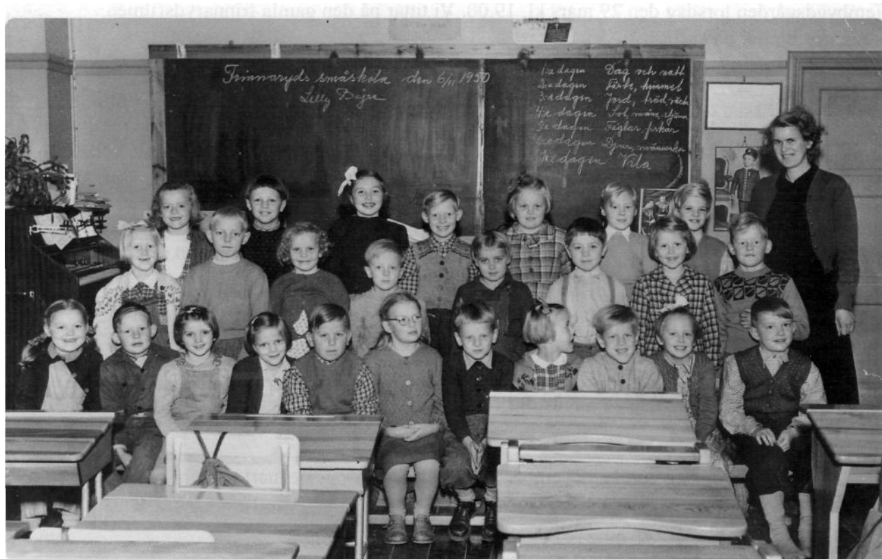
Frinnaryds småskola ht 1950.