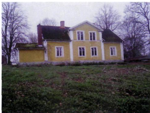
Hästeryd i november 2011

lande sluttningen ner mot Ralången har utan tvekan ett väsentligt kulturhistoriskt värde!