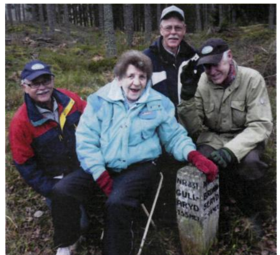
Samling runt väghållningsstenen Gullaryd/Brunseryd.