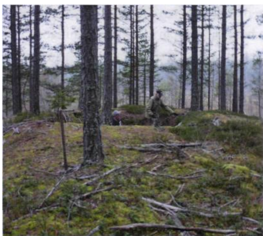
Unik fångstgrop i Socknamon på kulle mot mossmark.

De flesta som läser det här är säkert väl insatta i den dagsaktuella debatten om vargens plats i vår svenska fauna och känner till att det idag förekommer skydds jakt på varg då och då. Uppfattningen om vargens roll varierar som vi alla vet. Att synen på varg och andra rovdjur var tämligen annorlunda för sådär 170 år sedan råder det ingen tvekan om, det framgår också tydligt av de protokollsutdrag som jag tänker presentera här. Utdragen är baserade på Frinnaryds kyrkoarkiv 1830 - 50-tal, speciellt sockenstämmoprotokollen som är en guldgruva, om man vill veta något om de lokala förhållandena. Lite om sociala problem och levnadsvillkor under den aktuella tiden blir det också fråga om i min krönika, liksom några reflektioner om sjukdomar och hälsoläge i en liten Smålandssocken. Vi bör ha klart för oss att epidemier som kolera, koppor och rödsot fortfarande var ett reellt hot mot befolkningen för 170 år sedan, även om just smittkopporna hade gått tillbaka rejält i och med vaccineringen. Ett och annat bagatellartat, kanske rentav komiskt, inslag i protokollen berör jag också kortfattat.