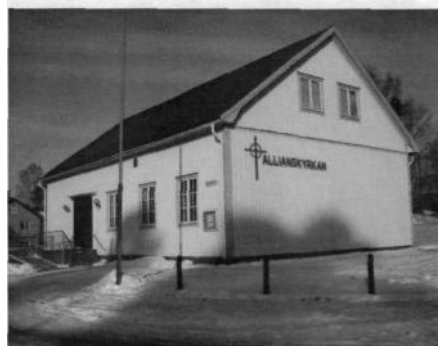
Allianskyrkan i Sunhultsbrunn 2012.

Församlingen är ansluten till Svenska Alliansmissionen (SAM).