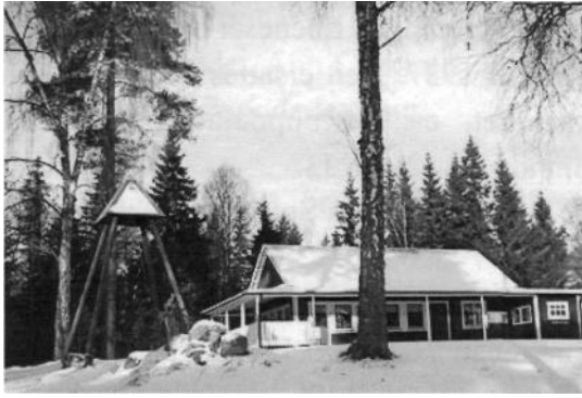
Dagstorp's lägergård i vinterskrud.

Under många år var missionsmötet på midsommardagen en tradition. Missionshuset var fyllt till trängsel vid dessa tillfällen, eftersom mycket folk brukade komma till Sunhultsbrunn vid midsommartid för att dricka järnvatten. I början av 40-talet ersattes dessa möten av Sunhultskonferensen, som sedan dess hållits en veckohelg i maj-juni varje år.