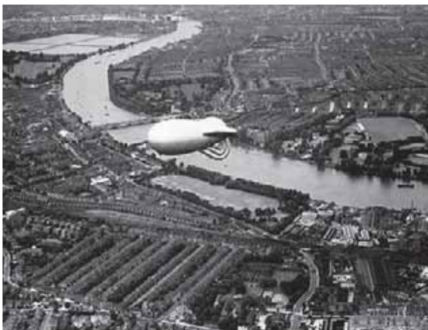
Spärrballong över Thamesen

Alla fönster skulle täckas för med svart "mörkläggningsspapper". Ordningsmakten gick runt och kontrollerade att inget ljus sipprade ut. Utomhuslampor skulle vara släckta. Bil- och cykelstrålkastare skulle vara försedda med avskärmning uppåt. Det blev helt svart utomhus på kvällar och nätter.