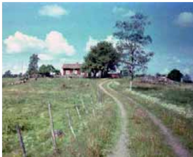
Huset på Kullen anno 1984