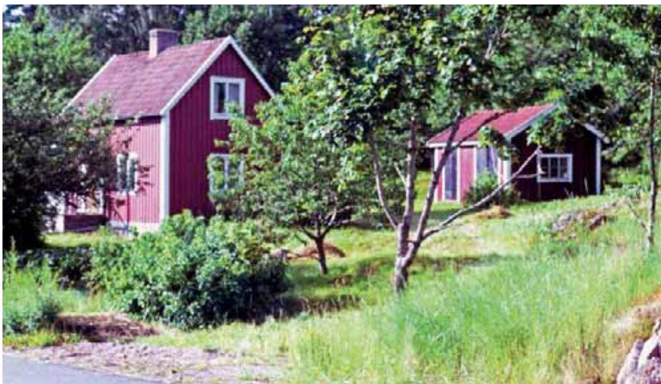
”Alphyddan” i Sunhultsbrunn. På berget till höger låg Sunhults brandstation som revs någon gång på 60-talet.

Han hade avtal med Småland Kraft och fick ta el