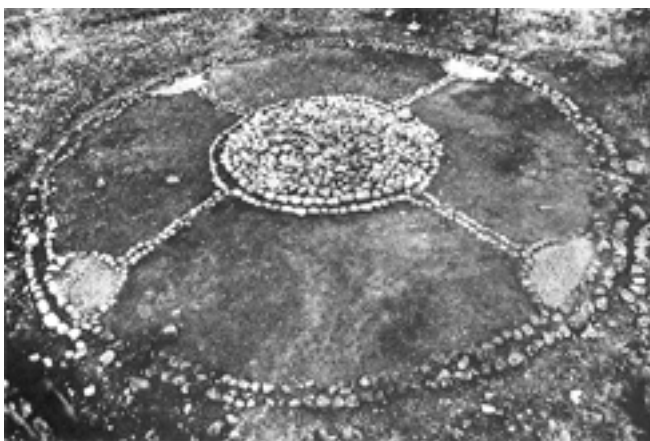
Ståtlig hjulkorsgrav vid Sälle, 17 m i diameter

Perioden 400 f Kr – 0 kännetecknas av en rikedom på gravfält, fyndlösa gravar och en brist på boplatzlämningar. Det var för att nå mera kunskap om denna period, som man satte igång ett forskningsprojekt bland annat på gravfälten vid Sälle i Fröjel. Målsättningen var en totalundersökning av gravfältet, vilket innebär att det inte bara är gravarna som studeras utan också de ytor som ligger mellan dem. I och med denna totalundersökning fann man en väg som löper genom gravfältet och delar det i två delar. Den märks som en fördjupning och syns tydligt på flygfoton. Vägen har kunnat följas 400 meter söder om gravfältet. Det är tydligt att man tagit hänsyn till vägen under gravläggningarna, och därigenom kan vi förstå att vägen är samtida eller äldre än gravfältet. Fältets största anläggning mäter 20 m i diameter. Troligen är det rester av ett bronsåldersröse, som vid gravfältets tillkomst plockats ned. Ett antal senare daterade gravläggningar har även gjorts i röset. Runt röset finner man de äldsta gravarna. Gravfältet har använts under cirka 500 år från tiden 300 f Kr fram till 200 e Kr. Många vackra hjulkorsgravar hörde till det man fann. Ett fåtal anläggningar har en senare datering.