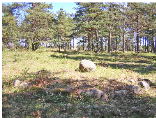
Gravfältet vid Sälle. Gravfältet har använts under cirka 500 år från tiden 300 f Kr och framåt.