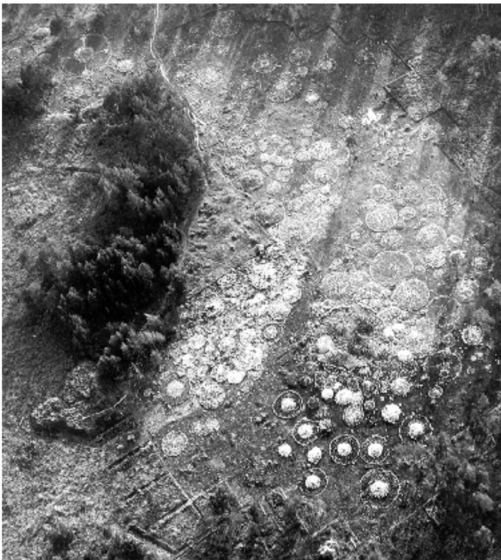
Sälle-gravfältet. Flygbild över gravfältsområdet med flertalet gravar frilagda

Antalet gravar uppskattades till 125 vilket senare skulle sig vara en mycket låg uppskattning. Efter undersökningen på 70- och 80-talen var man uppe i nära 500 gravläggningar! Många gånger var arbetet ganska trööst, då man ofta mötte tomma eller fyndlösa gravar och brända skelett.