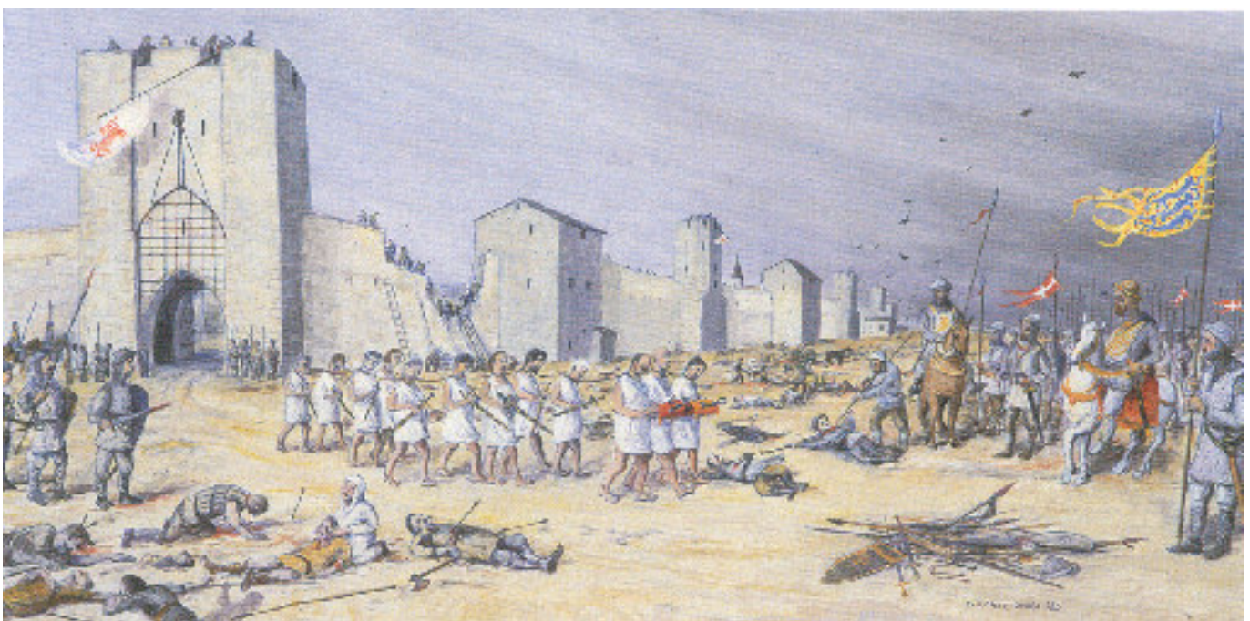
Underdånig underkastelse. Sedan gutahären besegrats öppnade Visby-borgarna portarna och överlämnade enligt tidens sed stadens nycklar till segerherren.

BILD hämtad ur boken "Gotland vår hembygd" av Erik Olsson, Sanda