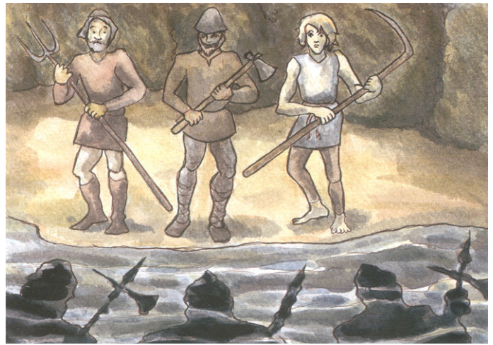
Ejmunds bro. Vid Ejmunds bro i Sanda ställdes Valdemars stridsvana knektar mot en i hast hopsamlad och illa rustad skara gutar.

Hitta dit: Besök gärna Ekstakusten och bilda din egen uppfattning om var Valdemar Atterdag landsteg!