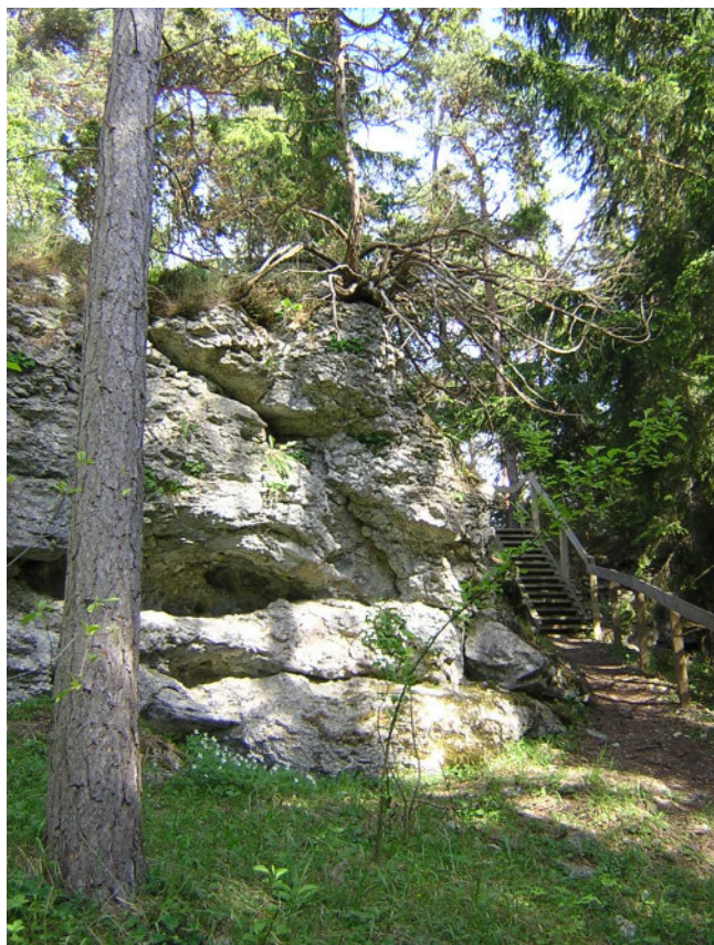
Trappa. På en del ställen går det förhållandevis enkelt att ta sig upp på platån, och på ett ställe finns det till och med en trappa.