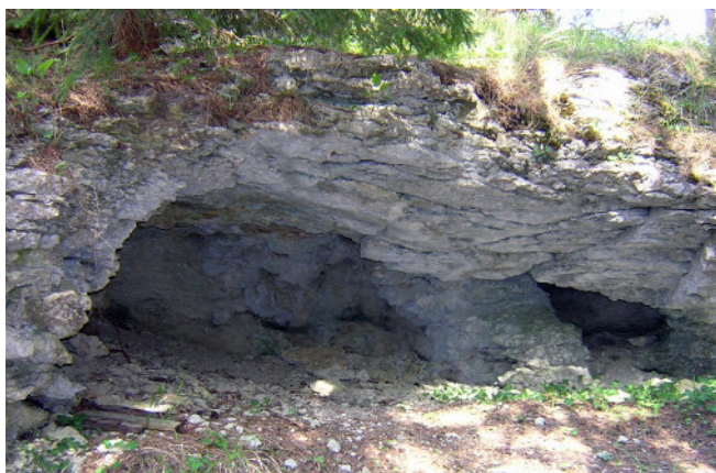
Grottbildningar. På flera ställen i klinten kan man se grottor och urholkningar.

Från vissa platser på platån kan man mellan trädtopparna ana en vid utsikt över Fröjel