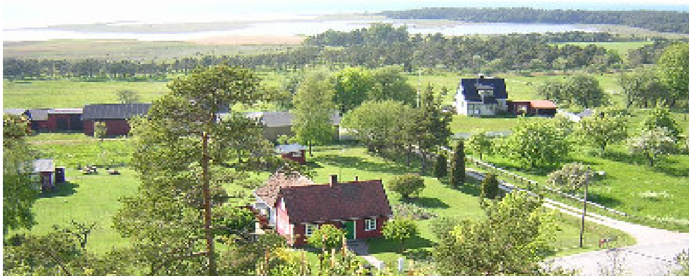
Utsikt över Gannarve-viken från Haugklintar

Hitta dit: Från rastplatsen vid väg 140, några hundra meter norr om Fröjel kyrka, går man tvärs över vägen och följer den stig som börjar där. Håll vänster direkt i första stigskalet efter 50 meter och sedan också tre hundra meter längre fram. Följ den väl upptrampade stigen ytterligare 300 meter, och du är framme vid utsiktvyerna!