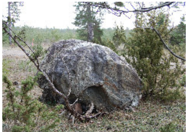
Två vilstenar finns ännu kvar i Fröjel, denna ca 1,5 km från kyrkan. Stanna till en stund och begrunda livets gång förr och nu.

Men så ligger den efterlängtrade vilstenen äntligen där, alldeles invid grusvägen! Det är ett stort flyttblock som inlandsisen så lägligt behagat släppa på just denna plats, och alla liktåg från övre Fröjel tar alltid en välbehövlig vilopaus här, med den oftast mycket enkla kistan placerad högst upp på stenen. Under lågmält samtal lägger sig männen i skuggan vid sidan av vägen, och