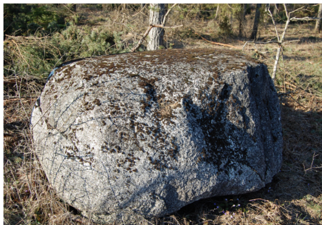
Två vilstenar finns kvar i Fröjel, denna vid vägskälet till Alstäde körkväg. Stanna en stund och begrunda livets gång förr och nu.

Men så ligger den efterlängtrade vilstenen äntligen där, alldeles invid grusvägen! Det är ett stort flyttblock som inlandsisen så lägligt behagat släppa på just denna plats, och alla liktåg från övre Fröjel tar alltid en välbehövlig vilopaus här, med den oftast mycket enkla kistan placerad högst upp på stenen. Under lågmält samtal lägger sig männen i skuggan vid sidan av vägen, och