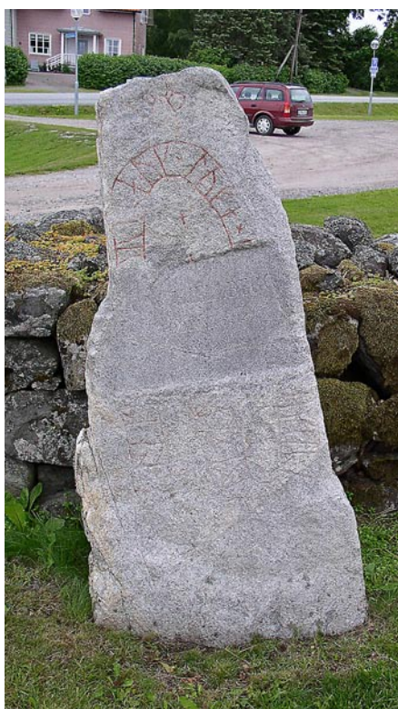
Runstenen som har använts som gravsten står på kyrkogården i Vada.