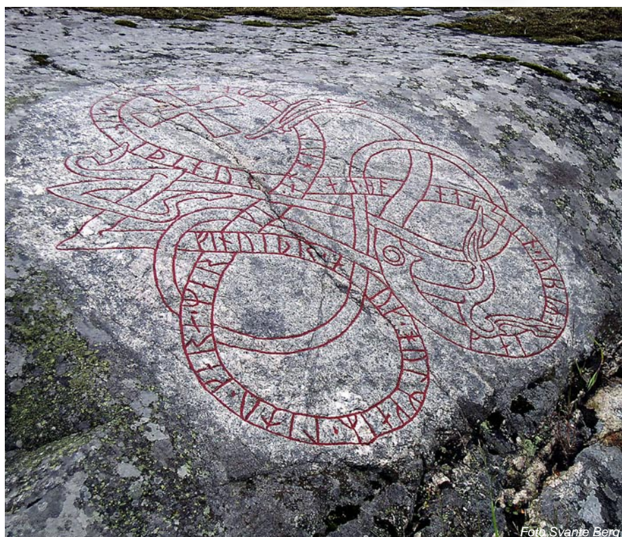
Vid Åsta nära Angarns kyrka finns den här vackra runhällen som Öpir har ristat åt Finnvid, Holmger och Hedenvi till minne av Holmgöt.