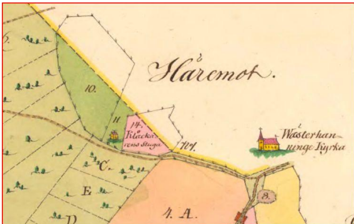
Figur 2 Karta från Ribby bys skogsmark, hagar och täppor år 1772.