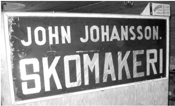
Skyltar på skomakerihusets utsida.