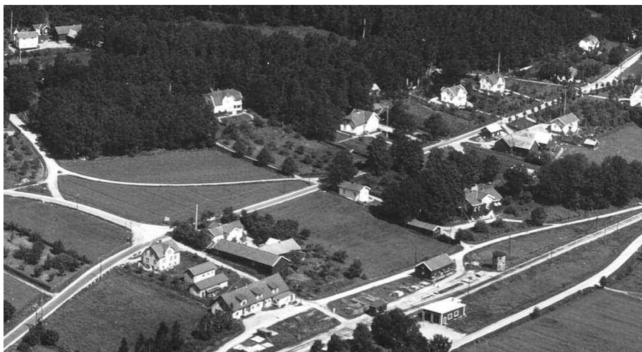
Skomakeriet är det lilla vita huset nästan mitt i bilden nära Framnäs hus. Nertill skymtar stationsområdet med Ekelunds lager och kontor. Foto: från 1930-talet.