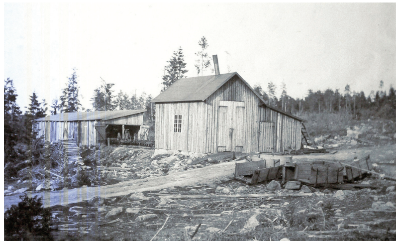
Lokstallet och smedjan i Attsjö.

1906 anlade Åry Bruk, som ägde ca 2000 hektar produktiv skogsmark i Attsjö, en järnväg för att transportera virke från skogen till Årydsjön varifrån det flottades till sågen i Åryd. Denna verksamhet fortsatte till 1930 då lastbilen tog över. Stora mängder virke avverkades och transporterades, något år 600 000 kubikfot. Denna verksamhet skapade många arbetstillfällen för ortsbefolkningen med huggning och körning under vintern. På vårkanten och försommaren transporterades virket på järnvägen till Årydsjön.