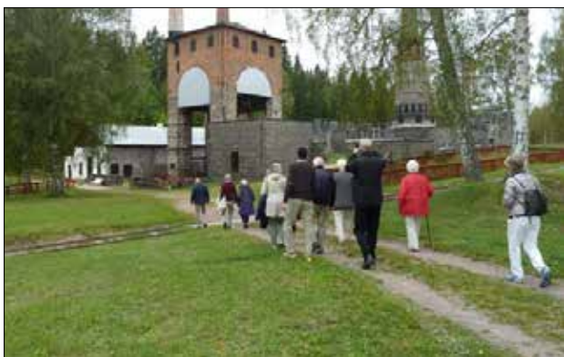
Mot järnbruket med masugn, rostugn, smedja mm travar vi nyfiket på.

Elsie berättade att kapellets intressenter är mycket aktiva även numera med olika musik- och