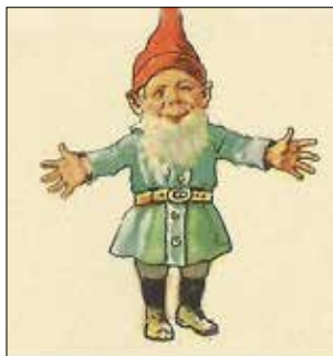
Gammaldags jul och försäljning i Guldsmeden m.m.

Förlåt, en fråga. Har Ni profvat Sasol-Tvålen?