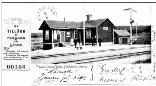
Järnvägs- och poststationen i Hånick 1905.