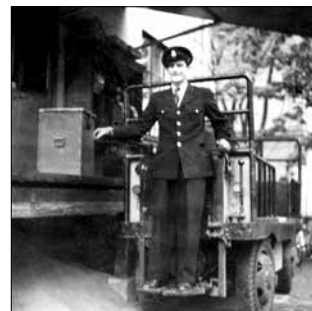
Posthistoria och brevbärarminnen.