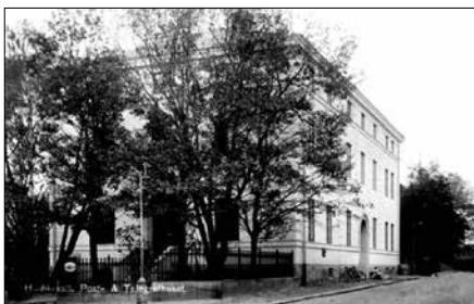
T v. Före detta post- och telegrafhuset på Käppuddsgatan i Hudiksvall.

En film från 1943 om postsortering på järnväg visades före kaffepausen.