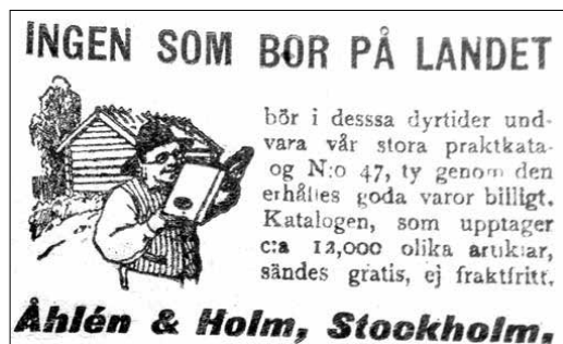
Hudiksvalls Posten för 100 år sedan.