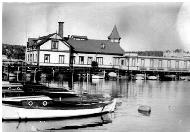
Fernes badhus vid Kattvikskajen.

Kring 1940 började man bygga badet nedanför Köpmanberget. Från början var vattenkvaliteten bra, men allt eftersom letade sig lorten ut även hit. Vid anläggningen pågick aktiviteter både sommartid med bad och vintertid med skridskor och tävlingar.