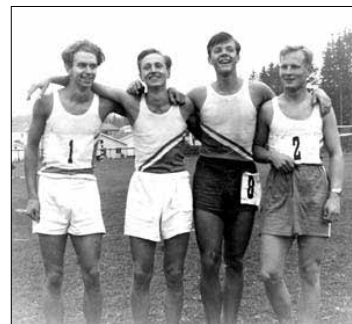
Från berättarkvällen i november.