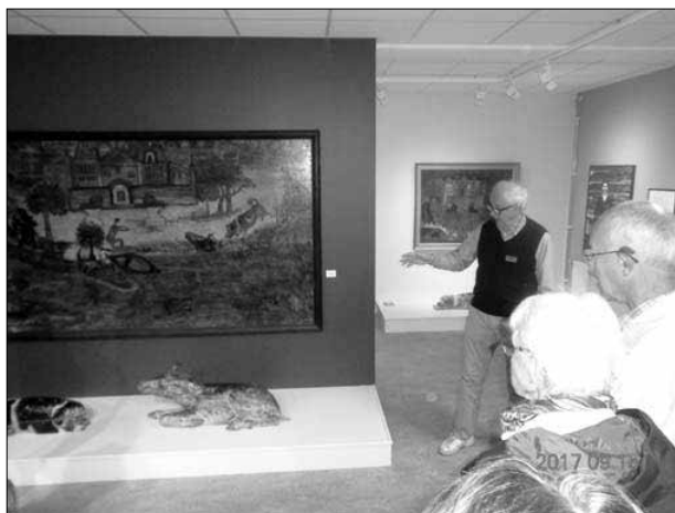
Från besöket på Edsbyns museum.

bilder från 1940-tal och senare. Uppseendeväckande skildring av hur smutsigt fjärdens vatten var innan reningsverket byggdes, så sent som 1963.