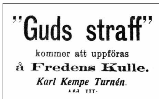
Hudiksvalls Posten 1918. Se sidorna 3-5.