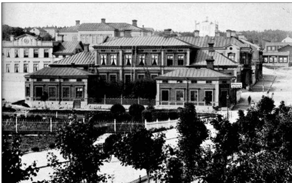
Lindegrens gård intill kanalen.