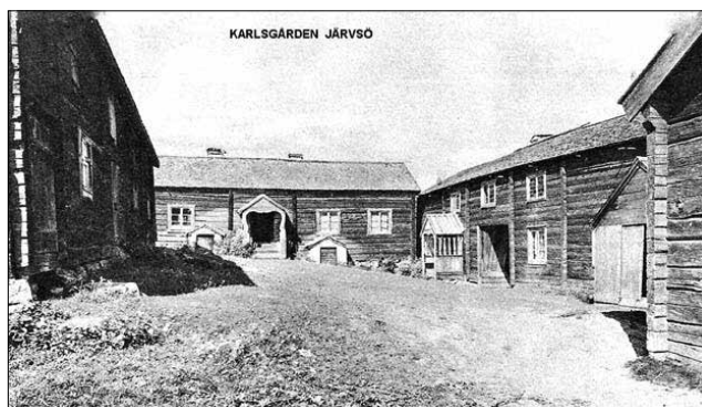
Ett av vårens utflyktsmål: Karlsgården i Järvsö. Se sida 2.