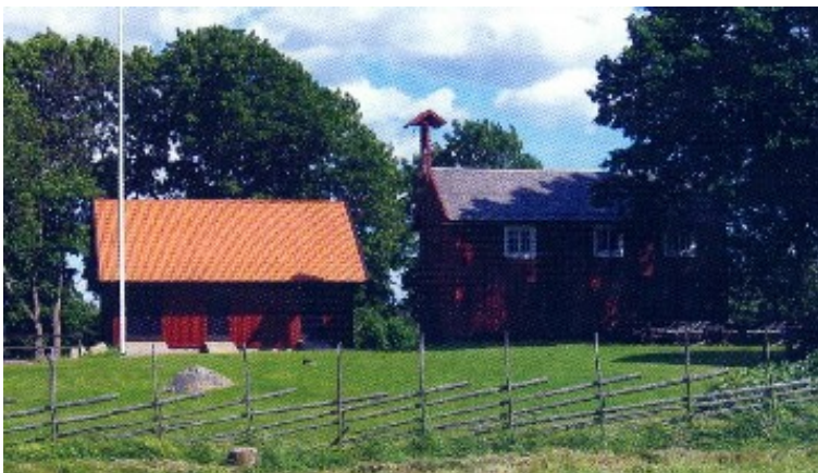
Det gamla magasinet (t.h.) och det nybyggda förrådshuset.