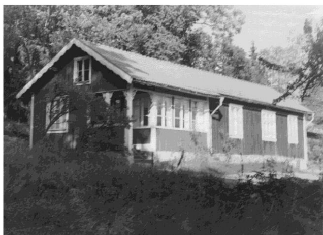
Bild från boningshuset Hanskärr 1974.

Om mangårdsbyggnaden står det i boken Gods och gårdar från 1940 att den skulle var uppförd omkring år 1700 och i boken Sveriges bebyggelse från 1952 att huset är från 1850.