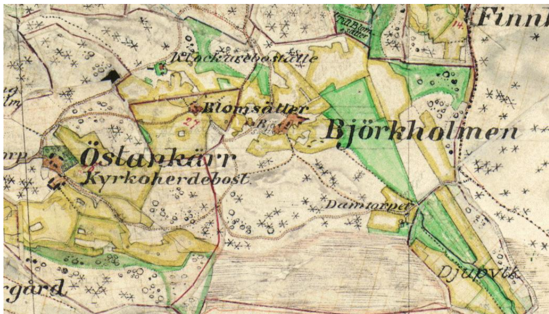
Häradscharta från 1868