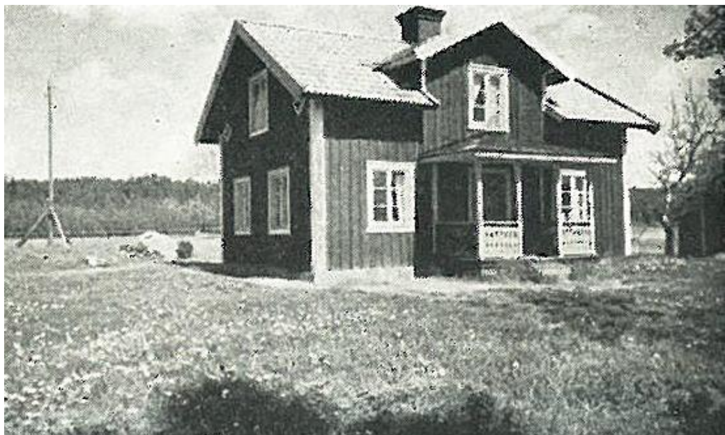
Det västra Österhagen 1952 innan fönstren bytts ut och verandan byggts in.