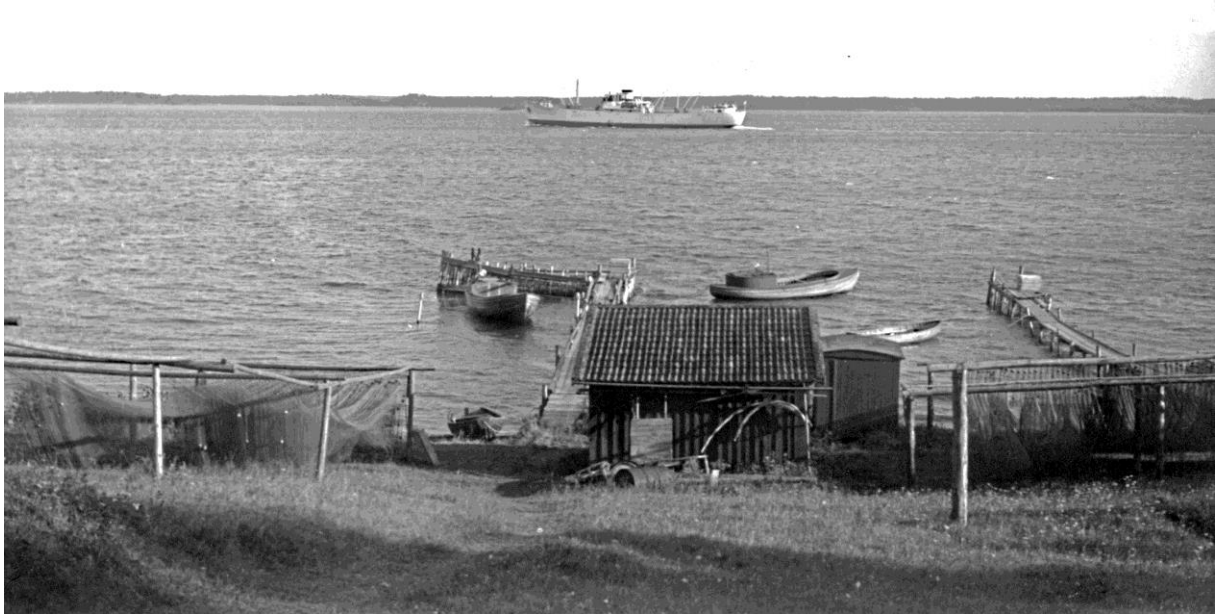
En bild från 1946 som visar "fiskehamnen" med Österhagens två fiskebåtar och skötgårdarna.