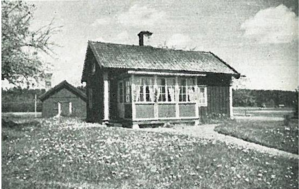
Det östra Österhagen 1952 innan en andra våning byggdes på och verandan gjordes om. Observera att det lilla gamla huset bakom fortfarande hade eldstad då.