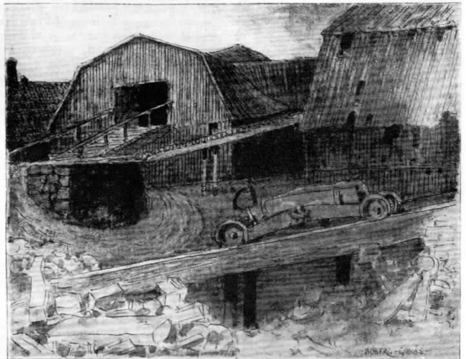
Kolhus vid Gonäs hytta, rivna år 1931 (Sveriges sista drivna bergsmanshytta). Kolteckning av Ferdinand Boberg.

Ludvika Hembygdsförening har emellertid sin höstfest den 29.-30 juli till förmån för Gammelgården och vi äro glada och känna oss vänligt