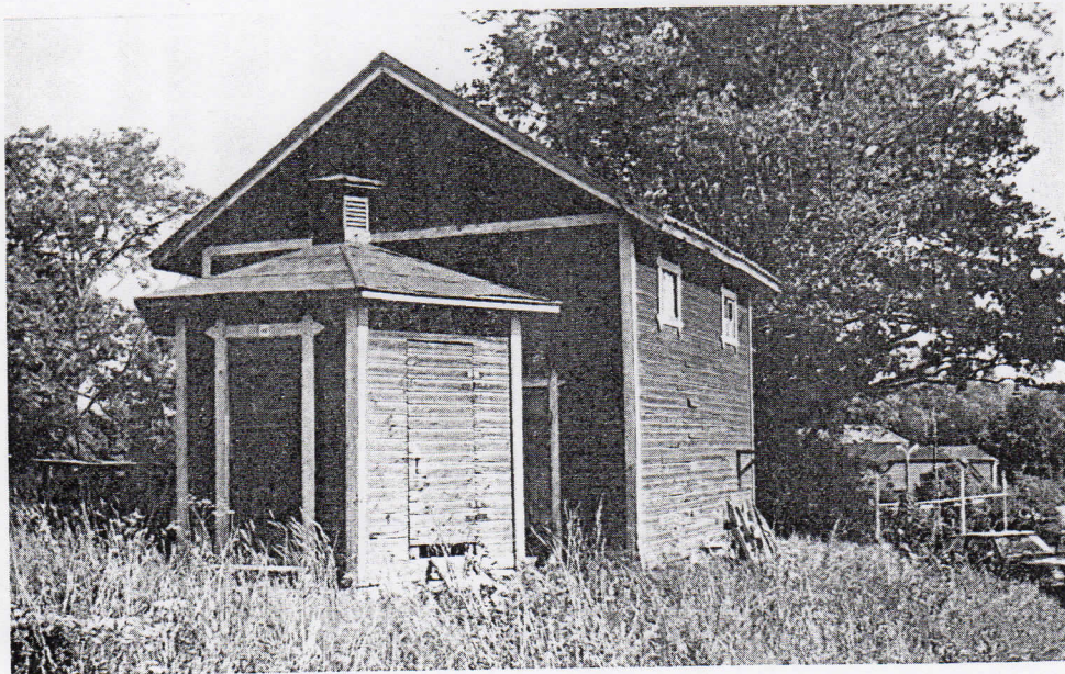
Bild 5. Uthus och ett sexkantigt uthus i nedre delen av den västra raden. Dessa sexkantiga dass kallades karuseller. När dessa och de stora röda bostäderna var färdiga ansågs det ha blivit någorlunda mänskligt på Hammarbacken.

Enligt en tidningsartikel fanns på Hammarbacken vid sekelskiftet endast de vita kasernerna och en röd kåk med klocka på gaveln och intill detta ett svinhus, där hyresgästerna kunde spara ihop till lite julmat. Så fanns det förstås ett gemensamt hus för hyresgästernas bekvämlighet. Där skedde ingången genom en låg dörr och huset var gemensamt för män och kvinnor utan mellanväggar eller annan lyx. Enskilda sittplatser kom först när de sexkantiga dassen byggdes i samband med de stora röda kasernerna år 1905.