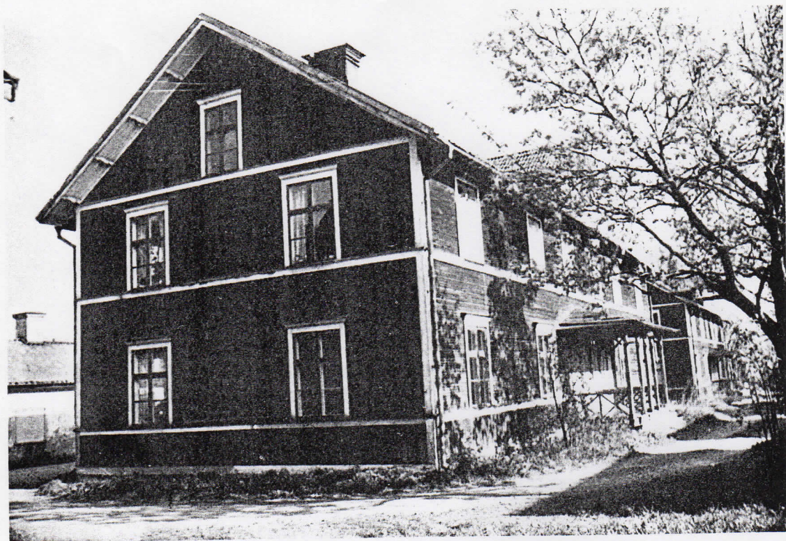
Bild 4. Tvåvånings träbyggnader på Hammarbacken. Gaveln vetter mot norr och långsidan mot väster. Till vänster om byggnaderna finns Bruksgatan och där syns även något av de vita slaggstensbyggnaderna. På långsidan syns en veranda med fyra dörrar. En likadan veranda fanns på husets andra långsida mot bruksgatan. våren 1973. Fotonummer 9 - 73 : 34.

Enligt en tidningsartikel fanns på Hammarbacken vid sekelskiftet endast de vita kasernerna och en röd kåk med klocka på gaveln och intill detta ett svinhus, där hyresgästerna kunde spara ihop till lite julmat. Så fanns det förstås ett gemensamt hus för hyresgästernas bekvämlighet. Där skedde ingången genom en låg dörr och huset var gemensamt för män och kvinnor utan mellanväggar eller annan lyx. Enskilda sittplatser kom först när de sexkantiga dassen byggdes i samband med de stora röda kasernerna år 1905.