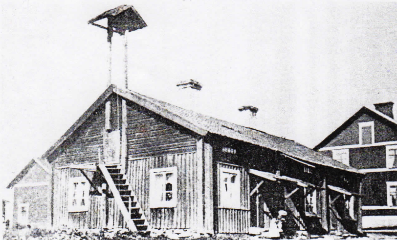
Bild 3. Detta gamla envånings trähus med så kallad välling - klocka och utvändig trappa till vinden har legat högst upp i östra raden men är sedan lång tid nedrivet. Det stod dock kvar vid sekelskiftet.

1. Ludvika kyrka. 2. Ludvika Herrgård med sina två flyglar. 3. Tre envånings bruksbostäder av slaggsten. 4. Bruksbostäder av trä. 5. Bruksgatan. 6. Stånggång från ett vattenhjul vid strömmen till pumpar i en gruva vid sidan om gamla vägen till Grangärde. 7. Sockenstugan. 8. Kyrk - kvarteret skymtar i lövverket. 9. Stora kolhuset. 10. Skrasselforsen med sina två små flyglar. 11. Hus på Prästgårdsg. 12. Bryggeriet. 13. Ludvika ström. 14. Gamla forsbron av trä. 15. Brukets smedja. 16. Det så kallade Gnisterhuset. 17. Gamla landsvägen till Håksberg och Grangärde. 18. Smedjebacksbanan passerade i skogen bakom kyrkan och framför Sockenstugan. 19. Högberget. Fotonummer 11 - 88 : 24 + 9 - 49 : 17.