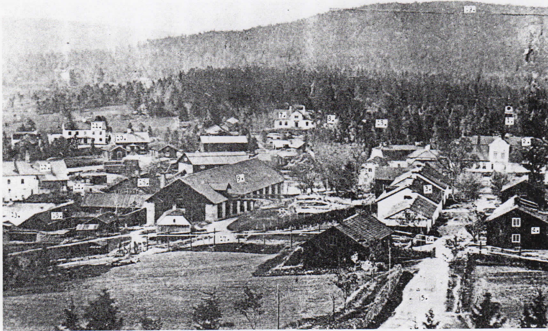
Foto av Ludvikas industriområde från 1870, taget från Ludvika bruks skola högst uppe på Hammarbacken.

I dag återstår på Hammarbacken en del bruksbostäder. De tillhör säkerligen ej den tidigare bruksperioden utan snarare den senare. Husen är grupperade i två rader längs en bruksgata som dock ej har något namn men som med all rätt borde kallas Bruksgatan. De två östligaste är byggda av slaggsten och torde utan tvivel vara äldst. De övriga är byggda av trä i två våningar och enligt vissa uppgifter skulle de vara byggda så sent som på 1900 - talets början. Slaggstenshusens antal torde från början ha varit tre. Detta framgår av ett foto från år 1870. Se nedan: