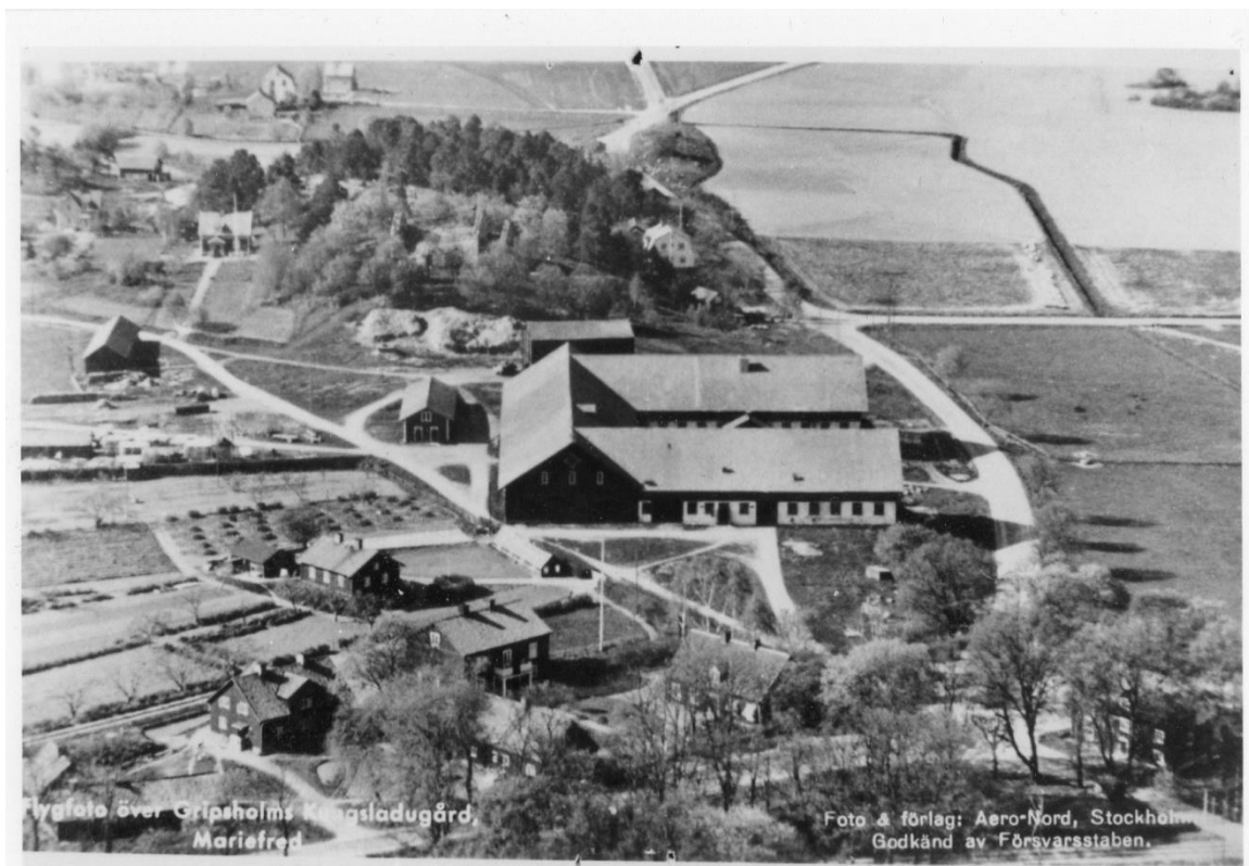
Flygfoto över Gripsholms Kungsladugård.

De flesta av Gripsholms Kungsladugårds byggnader var ekonomi-byggnader. De hade en enkel karaktär och beståndet har förändrats genom åren.