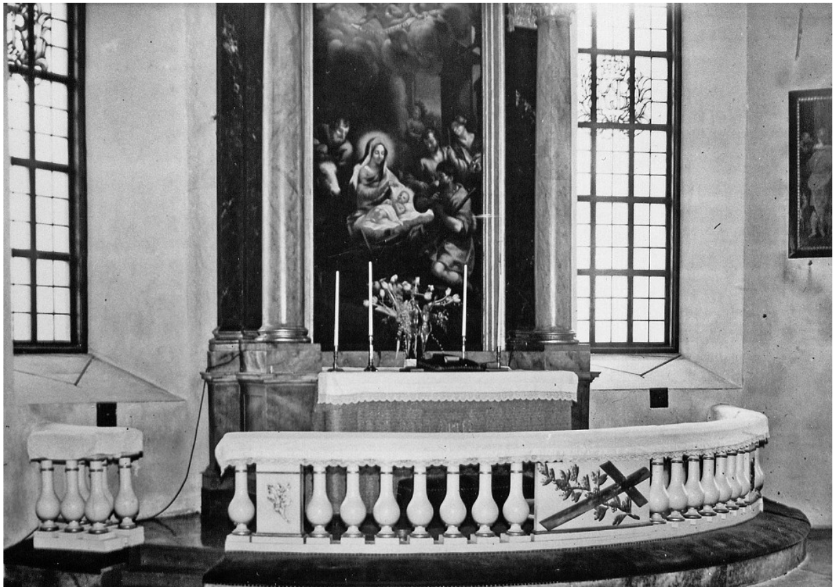
Bild 3. Altaret med altartavlan "Herdarnas tillbedjan" med Jesus och Maria i centrum. Bilden tagen mellan åren 1936 o. 1953