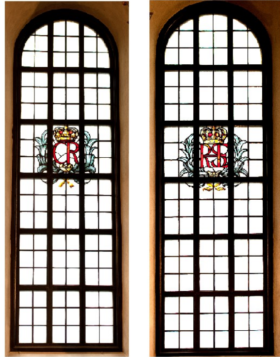
Bild 2. Monogrammen i korets två fönster