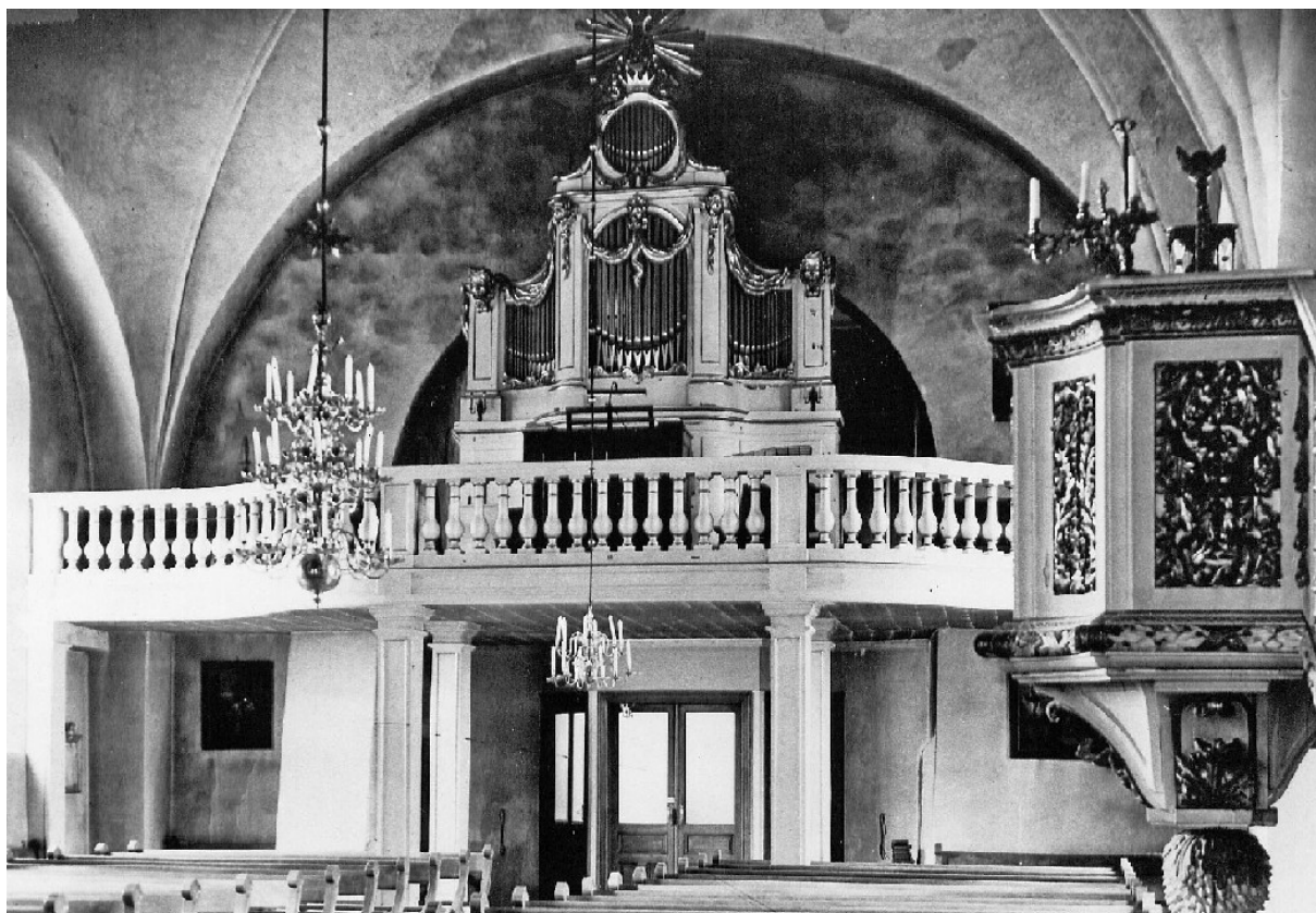
Orgelläktaren med orgel. Notera de öppna bänkarna. Bilden från före 1954

och unik i sitt slag. Orgeln är väl ansedd av de kyrkomusiker som får möjlighet att spela på den.