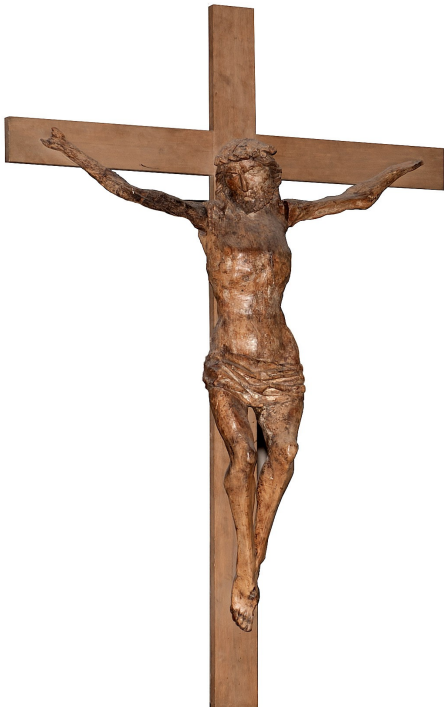
Bild 1. Triumf-krucifixet