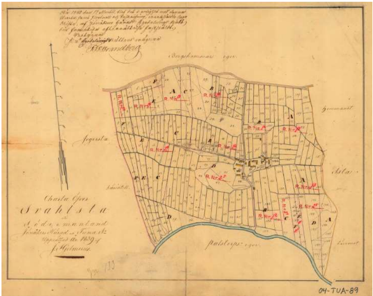
Detalj av bebyggelsen i den ursprungliga byn: