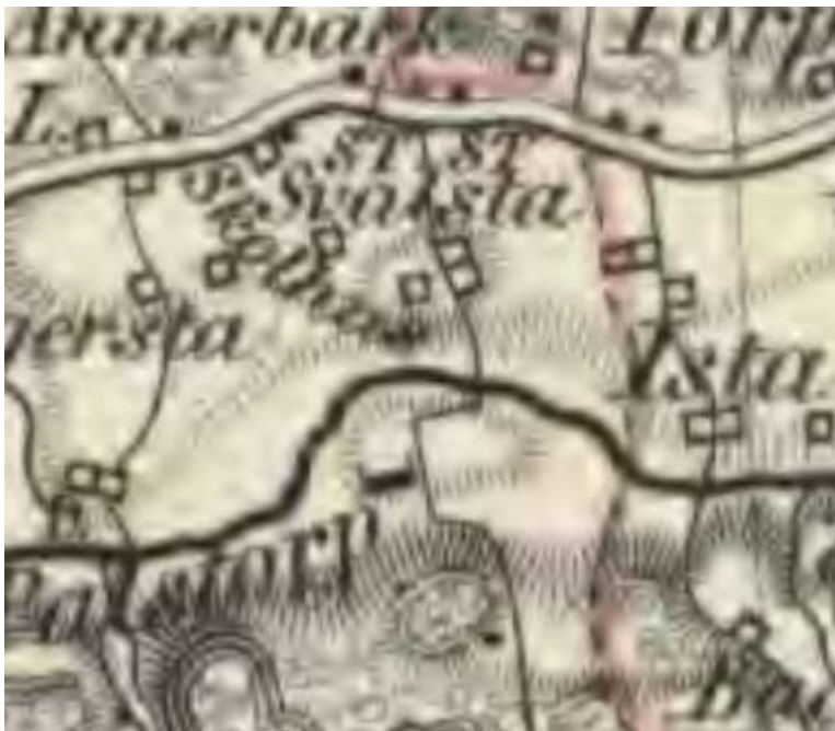
Generalstabskartan Norrköping, uppmätt 1851, översedd 1872.

En gård anlades ca 250 m väster om Palstorpsvägen. All bebyggelse där är riven men husgrunder finns kvar. Okänt när husen revs.